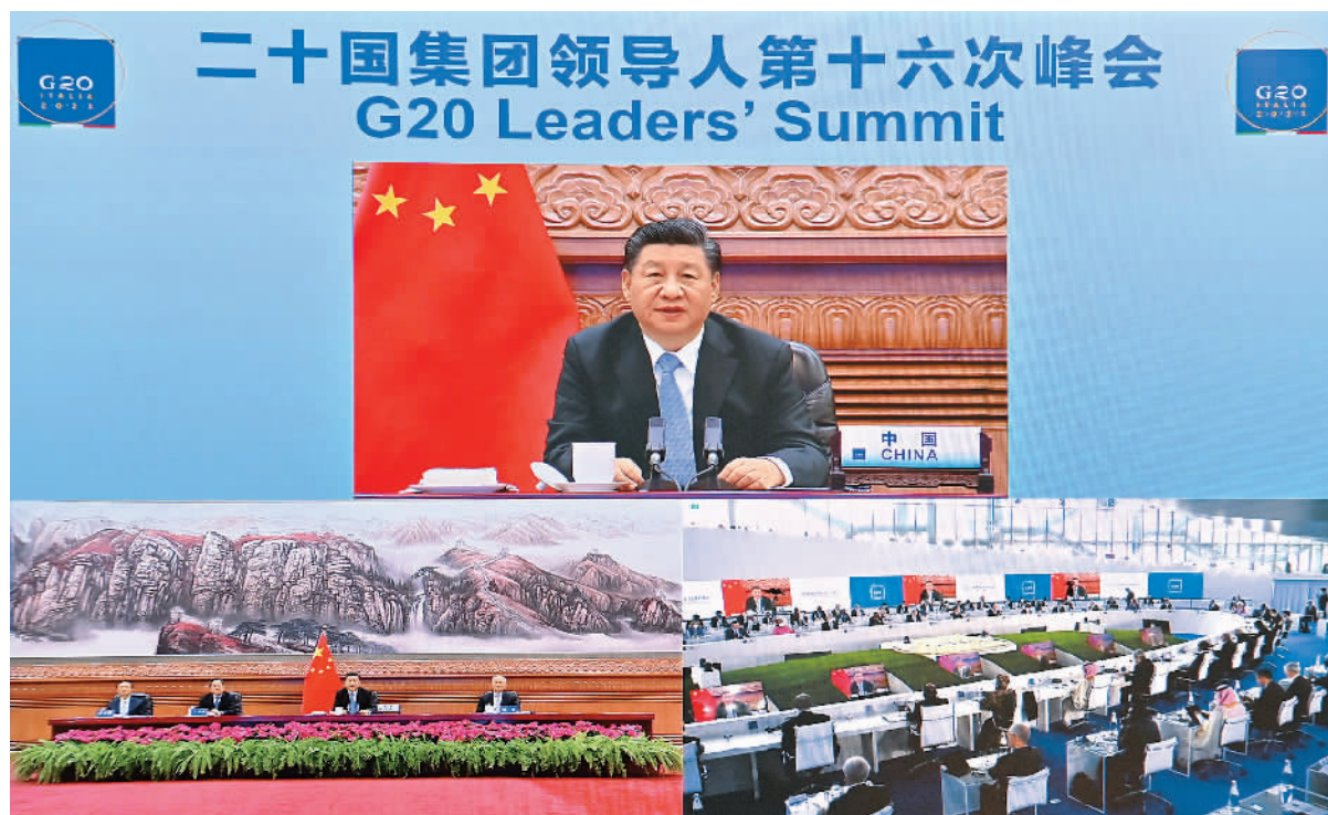
十月三十一日晚,国家主席习近平在北京继续以视频方式出席二十国集团领导人第十六次峰会。

■ 气候变化和能源问题是当前突出的全球性挑战,事关国际社会共同利益,也关系地球未来。国际社会合力应对挑战的意愿和动力不断上升,关键是要拿出实际行动。第一,采取全面均衡的政策举措。必须统筹环境保护和经济发展,兼顾应对气候变化和保障民生,主要经济体应该就此加强合作。第二,全面有效落实《联合国气候变化框架公约》及其《巴黎协定》。要坚持联合国主渠道地位,以共同但有区别的责任原则为基石,以国际法为基础,以有效行动为导向,强化自身行动,提升合作水平。第三,加大对发展中国家支持力度。二十国集团成员应该率先促进先进技术推广运用,发达国家也要切实履行承诺,为发展中国家提供资金支持