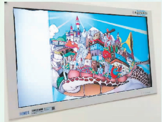
显示器上循环播放各种色彩艳丽的卡通图片。

小荷毕竟太小，有些紧张，差不多快要哭了。输液护士鼓励小荷，就疼一下下，像被蜜蜂扎一下。她还让小荷看墙上的显示器，显示器上循环播放各种色彩艳丽的卡通图片，非常漂亮，小荷终于放松地笑了。