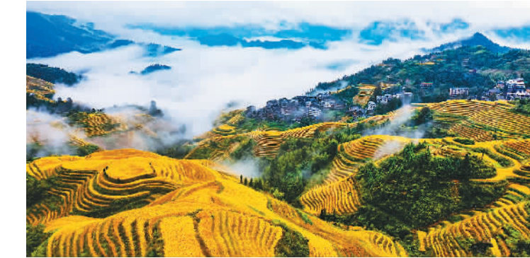
近年来，广西壮族自治区桂林市龙胜各族自治县依托秀丽的梯田风光，积极引导村民以田地山林资源入股，做起旅游生意。图为该县龙脊梯田云海景观。

深入学习贯彻习近平法治思想 扎实有效开展新时代法治宣传教育 黄坤明在第九次全国法治宣传教育工作会议上强调 新华社北京10月28日电 10月28日，第九次全国法治宣传教育工作会议在京召开。中共中央政治局委员、中宣部部长、中央全面依法治国委员会守法普法协调小组组长黄坤明出席会议并讲话，强调要深入学习贯彻习近平法治思想，贯彻落实中央全面依法治国工作会议精神，聚焦全面建设社会主义现代化国家目标要求，扎实有效开展新时代法治宣传教育，切实做好“八五”普法工作，在全社会大力营造尊法学法守法用法的良好氛围。 黄坤明指出，过去五年，贯彻落实党中央决策部署，“七五”普法规划实施完成，全社会法治观念明显增强，社会治理法治化水平明显提高，为推进全面依法治国、建设法治中国提供了重要基础。开展好新形势下法治宣传教育，要坚持守正创新，完善制度机制，把习近平法治思想贯彻到全民普法工作全过程，落实到“八五”普法工作各方面。要突出工作重点，抓好抓实公民终身法治教育，推进普法与依法治理有机融合，加强社会主义法治文化建设，增强普法工作针对性实效性，不断提升公民法治意识和法治素养。 中央全面依法治国委员会守法普法协调小组成员，中央和国家机关各部门普法办公室负责同志参加会议。会议以电视电话会议形式召开，各省市和新疆生产建设兵团党委宣传部设分会场。