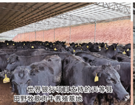
世界银行项目支持的天平等县田野牧歌肉牛养殖基地