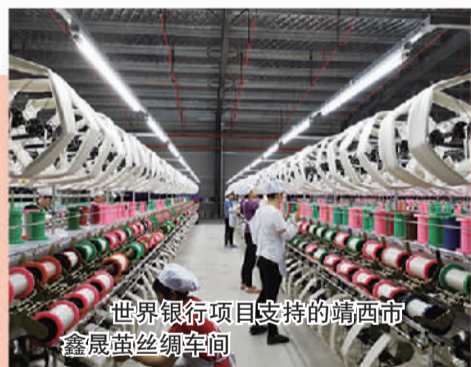
世界银行项目支持的靖西市鑫晨茧丝绸车间