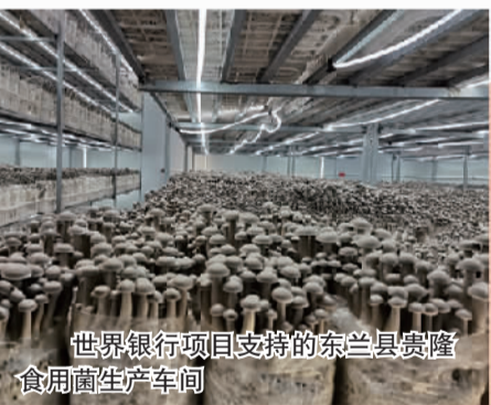
世界银行项目支持的东兰县贵隆食用菌生产车间