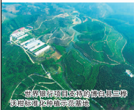
世界银行项目支持的博白县三桠沃柑标准化种植示范基地