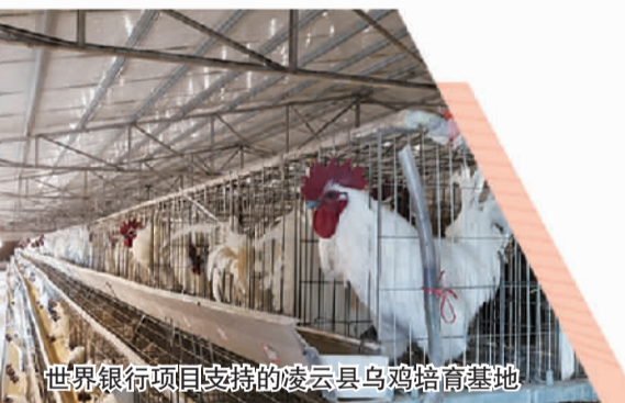
世界银行项目支持的凌云县乌鸡培育基地

今年是“十四五”开局之年，广西农业起步争先、提速发展，前三季度农业增加值增速达8.4%。广西农业外资项目管理中心（简称“外资中心”）以推进农业外资项目的实施为抓手，通过利用好世界银行结果导向型贷款，以发展地方农业特色产业为目标，为农村发展输入资金和技术，为农民生产生活水平改善注入强大活力，助力打造宜居宜业新农村。