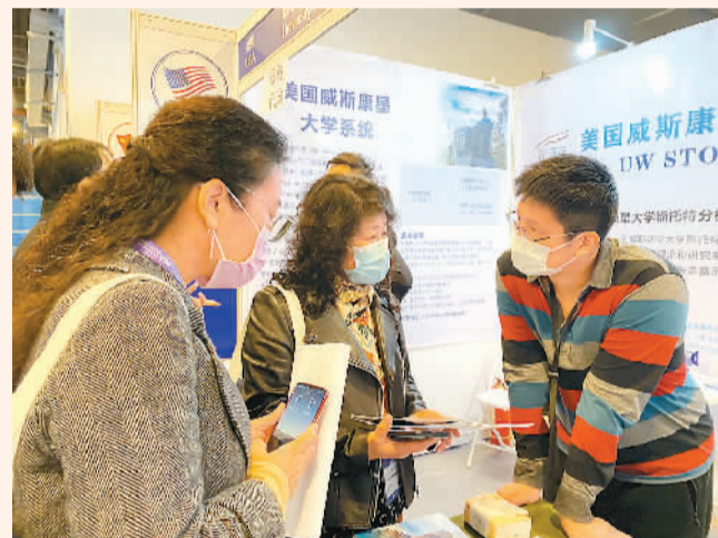
威斯康星州立大学斯托特分校展台吸引了不少寻求合作的中国院校代表。