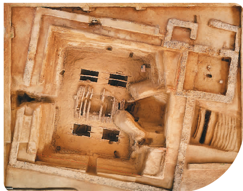
▲青海都兰热水墓群2018血渭一号墓全景。 资料照片 ▼游客在陕西西安秦始皇兵马俑博物馆参观。 王 冈摄（人民视觉）