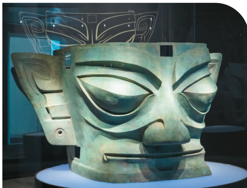
◀1986年出土于三星堆2号“祭祀坑”的青铜面具。该面具高72厘米，宽132厘米，是目前三星堆遗址出土所有面具中体量最大的一件。

今年是仰韶文化发现暨中国现代考古学诞生100周年。“百年百大考古发现”终评结果日前公布，河南偃师二里头遗址、河南浉池仰韶村遗址、江西新干商代大墓、四川广汉三星堆遗址、陕西秦始皇陵、甘肃敦煌莫高窟、青海都兰热水墓群等入选。“百年百大考古发现”涵盖31个省、自治区、直辖市及香港特别行政区、台湾地区。 经过几代考古工作者栉风沐雨、青灯黄卷，不同时期的重要文化遗存不断被发现和发掘。中华文明的历史轴线不断被拉长，历史信度不断在增强，文明细节不断被丰富。 科学的考古发掘，深刻改变了国人对祖先和历史的认知，也向世界系统、完整地揭示了源远流长、灿烂辉煌的中华文明。走过百年历程，如今考古愈发吸引社会各界尤其是年轻人的目光，每有重大发现，即成网络热点，不断增强着民族自豪感，也坚定了我们的文化自信。