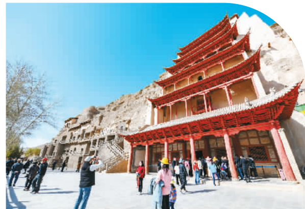
◀游客在甘肃敦煌莫高窟景区观光游览。