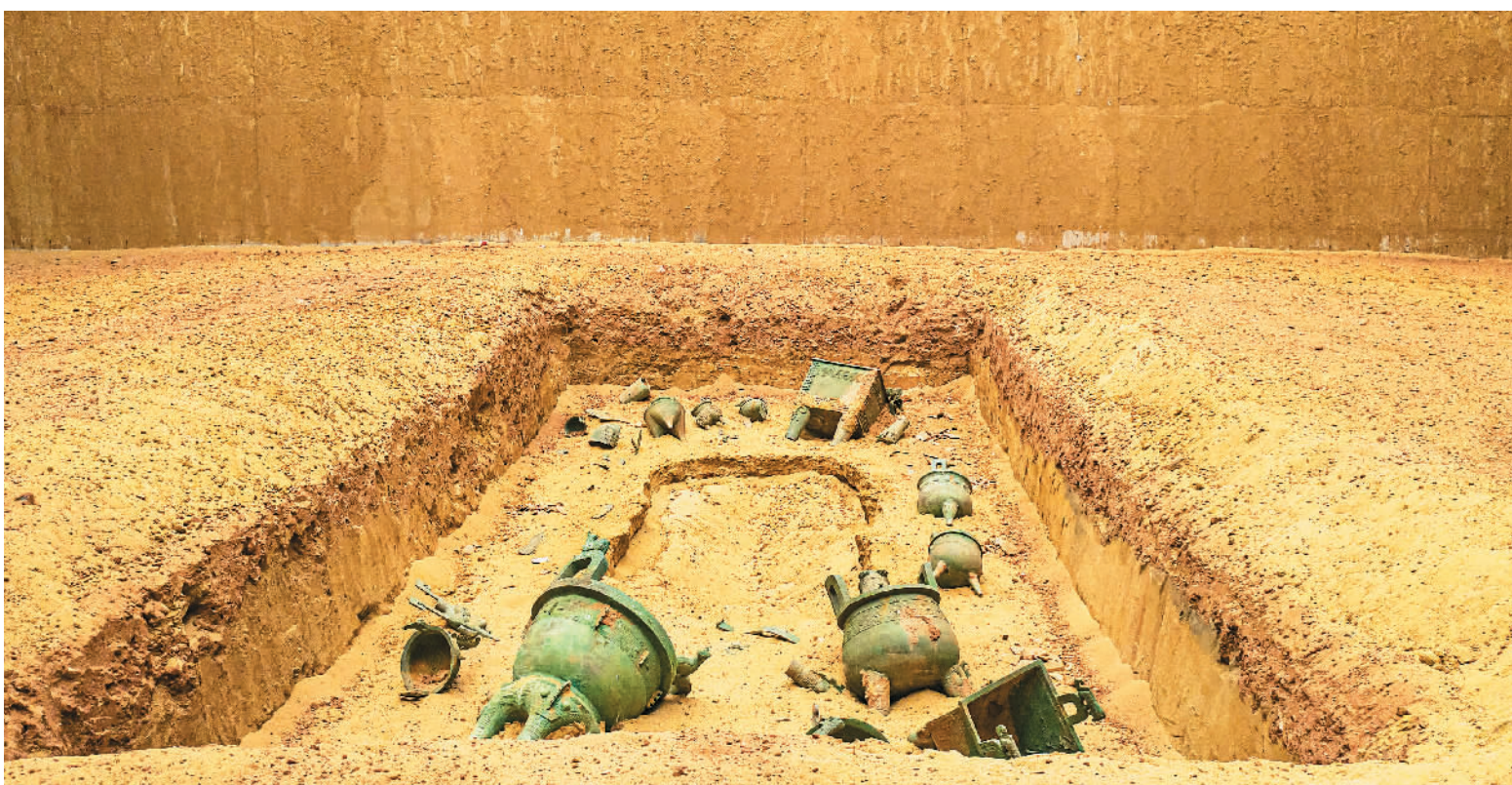
▼1989年，江西省新干县大洋洲商代大墓被发掘，出土了475件青铜器，754件玉器，139件陶件，将江南的文明史整整提前了1700多年。图为新干县青铜博物馆大洋洲商代大墓遗址展示。