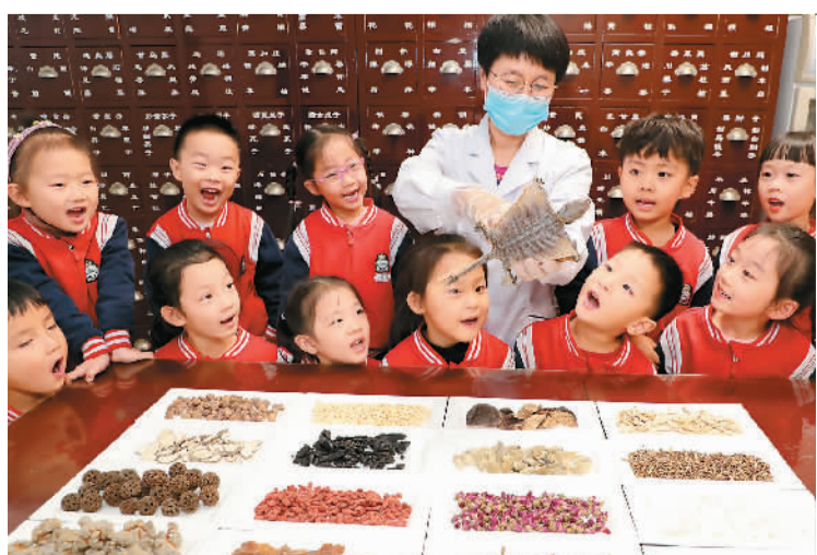
10月22日“世界传统医药日”前夕，山东省东营市东营区实验幼儿园组织小朋友来到医药诊所开展“认识中草药·感受中医文化”课外实践活动。

从那之后，为了活出高质量，我给自己下了死命令：改变不健康的生活方式！从今天起，做一个健康的人，锻炼、戒烟、早查早筛；从今天起，多吃水果和蔬菜；我有一个愿望，不得肠癌，春暖花开。