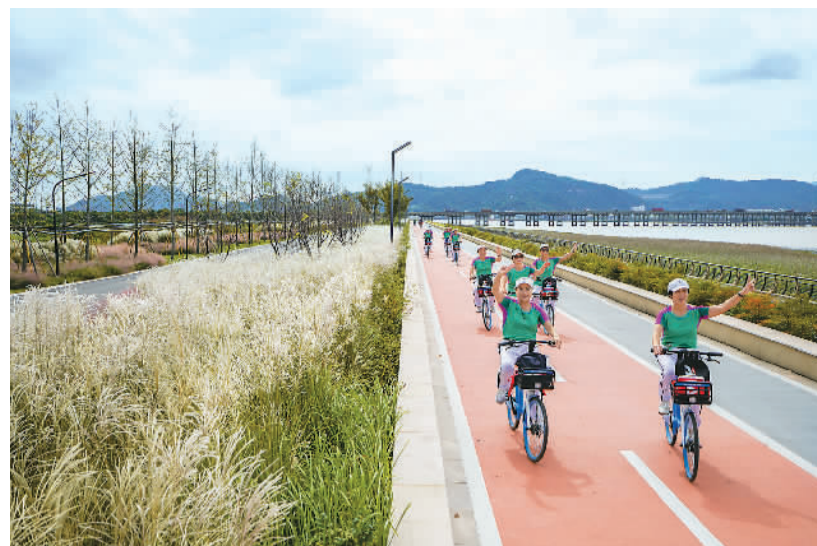
右图：10月16日，骑行爱好者在浙江省温州市七都街道防洪堤上骑行。