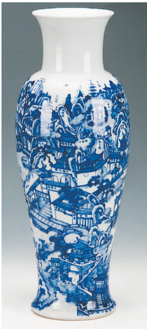
清康熙青花西湖风景观音瓶。