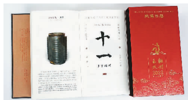
《2022陕博日历·玉耀九州》。