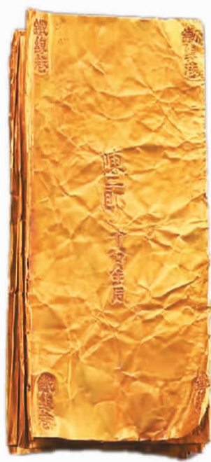
南宋“陈二郎”金叶子。

“‘陈二郎’金叶子为国家一级文物，反映了南宋杭州经济的发达。”潘沧桑说。金叶子由纯金制成，薄如纸，形似书页，上面刻有铭文“铁线巷陈二郎十分金”，其中“陈二郎”为制作金叶子的金铺名称。金叶子是南宋时期商品经济繁荣