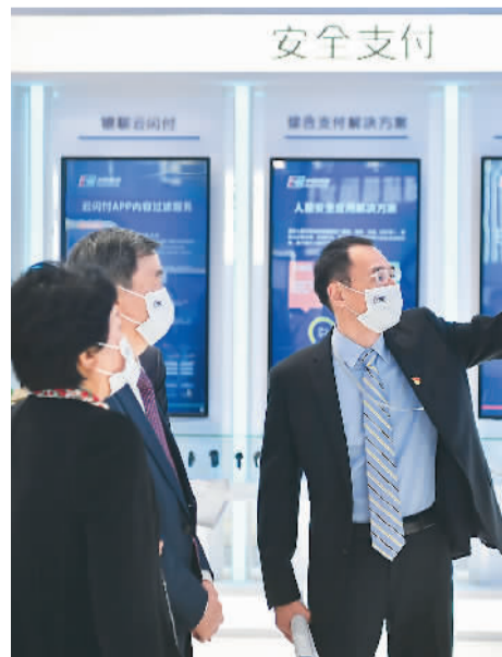
10月11日,观众在2021年国家网络安全宣传周网络安全博览会参观。

“互联网内容平台还应该识别低质内容并对其减少推荐,降低流量曝光;开展社区治理专项行动,打击有害不良内容与行为。”周源说,相信在政府、企业、网民等多方努力下,会形成崇尚科学理性、鼓励独立思考、拒绝愚昧反智的网络文化新风尚。