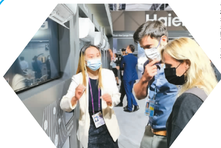
引海外采购商关注。本局广交会上，青岛海尔智能家居展台吸引