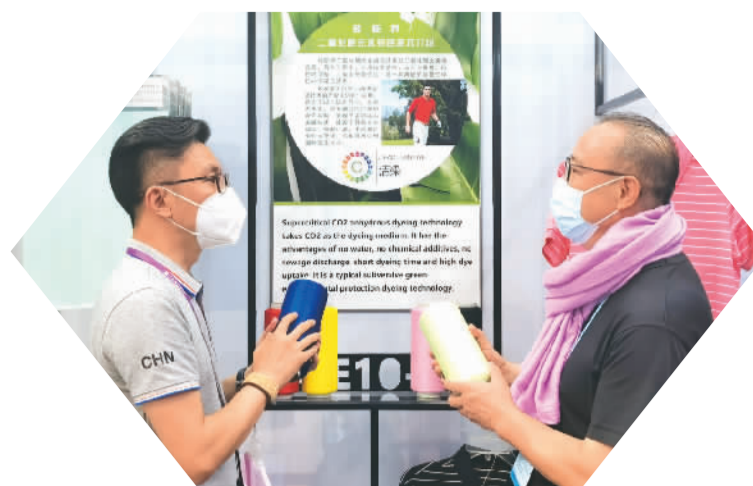
表介绍超临界二氧化碳无水染色产品。本局广交会上，青岛即发集团参会代