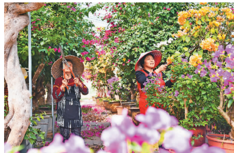
近日,浙江省台州市仙居县台湾农民创业园一家花卉种植基地内,农民正在对盆栽花木进行修枝,以促进生长。该县近年来采取“订单+基地+农户”的方式,积极发展花木、特色水果等产业,助力农民持续增收。