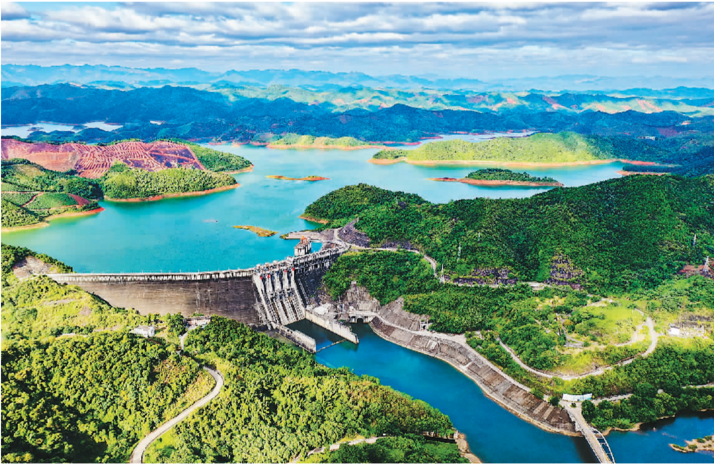
深秋时节,广西右江百色水利枢纽工程总库容五十六亿立方米,建成二十年来,为保障沿江中下游、粤港澳大湾区供水安全作出重要贡献。

“齐鲁风·两岸情”优秀中学生中华文化研习营活动自2004年举办以来,已累计邀请两岸百余所学校、数千名师生参加,成为具有广泛影响力的两岸青少年品牌交流活动。