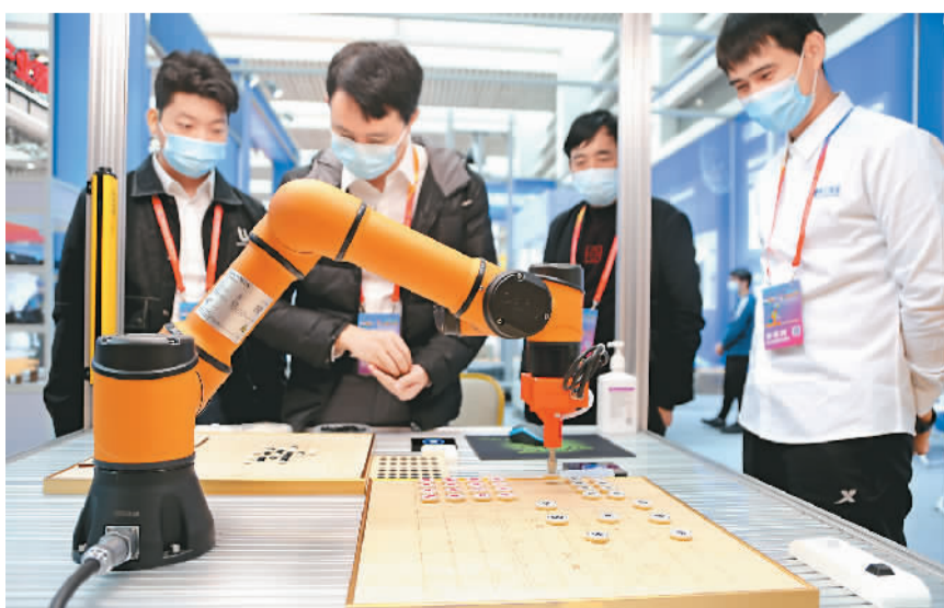
10月18日，为期3天的2021年第七届中国（连云港）丝绸之路国际物流博览会在江苏连云港市工业展览中心开幕。本届展会展区总面积3.7万平方米，吸引来自22个国家和地区的450家企业参展。图为观众在博览会上参观。

本次数字人民币应用场景落地园区，试点于高频高并发、小额消费类场景。同时，园区运营、安保等人员也进行了应用培训。