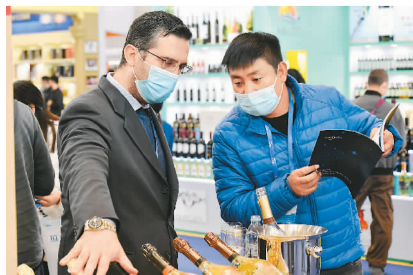
10月19日，第105届全国糖酒商品交易会在位于天津的国家会展中心（天津）开幕，本届糖酒会设置酒类、葡萄酒及国际烈酒、食品及饮料、调味品、食品机械、包装等六大展区。图为参展商向观众介绍产品。

近年来，标准化法体系不断健全，标准数量和质量大幅提升。“在标准供给方面，我国已发布国家标准4万多项、行业标准7.6万多项、地方标准5.3万多项，团体标准近3万项，自我声明公开的企业标准超过200多万项。”田世宏表示，《纲要》明确要求优化标准化治理结构、提升标准化治理效能、增强标准国际化水平，加快构建推动高质量发展的标准体系，助力高技术产业，促进高水平开放，引领高质量发展，为全面建设社会主义现代化强国、实现中华民族伟大复兴的中国梦提供有力支撑。