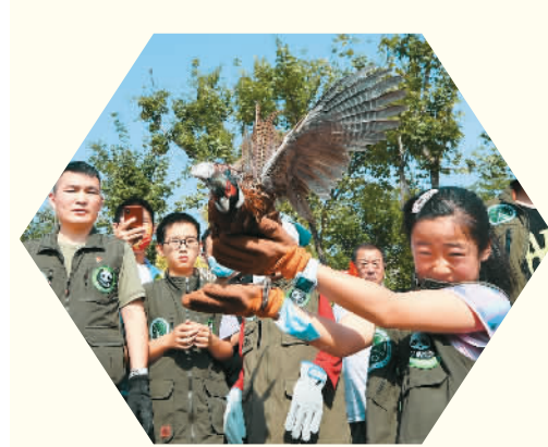
山东省青岛市城阳区野生动植物保护志愿者在流亭街道白沙河入海口湿地通过放归鸟类、安装红外线相机、清除违禁网具等方式保护生物多样性。图为志愿者在放归救助的雕鸮。