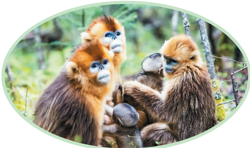
金丝猴在神农架国家公园大龙潭金丝猴野外研究基地山林中活动。