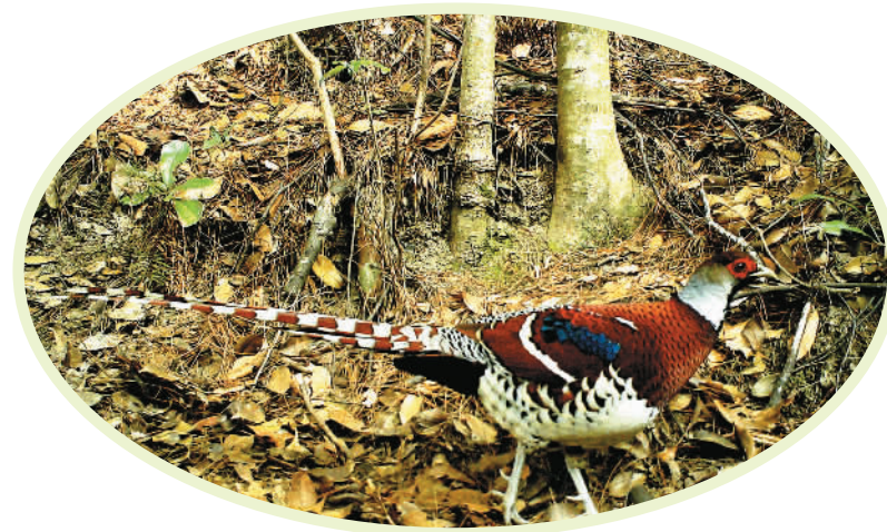
在钱江源国家公园体制试点区拍摄的国家一级保护动物白颈长尾雉。