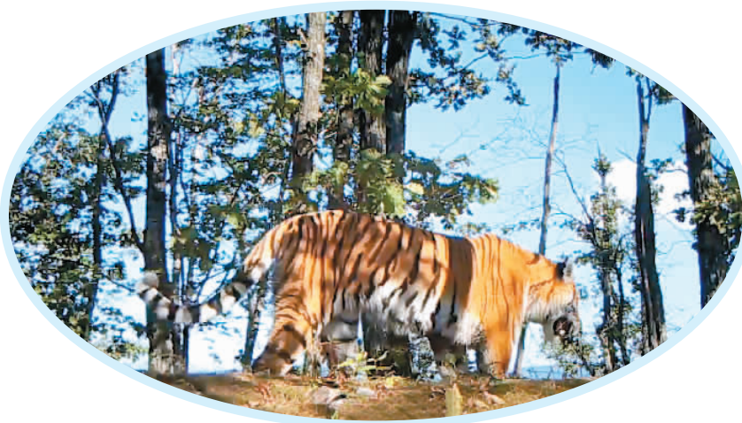
这是架设在东北虎豹国家公园内的远红外相机拍摄到的野生东北虎影像（视频截图）。