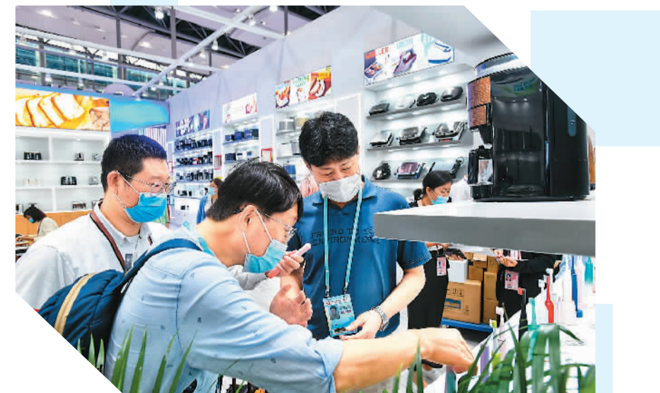
▲3名来自韩国的采购商在广交会小电器展台选购产品。

老客户沟通开拓合作边界，为全球消费者提供高品质高科技的产品和服务，把中国一流的产品、服务和技术推向全球每一个角落。