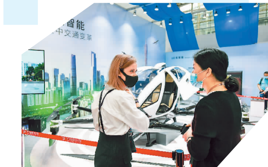
▲广交会展馆内，外国观众对中国企业的一款载人无人机产品发出赞叹。