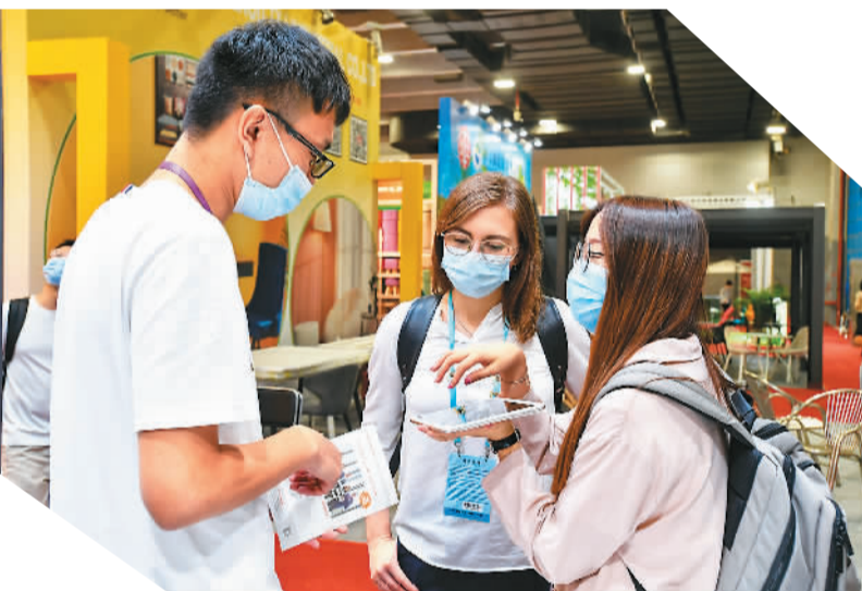
▲一名国外参会者（中）在广交会上和展商洽谈。