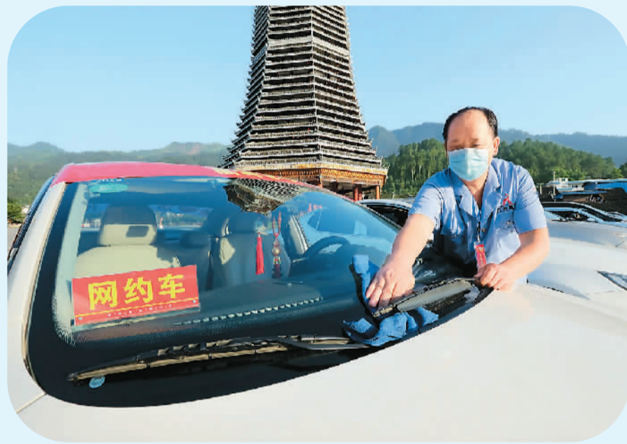
在贵州省黔东南苗族侗族自治州榕江县，一名网约车司机正擦拭汽车。

不仅如此，随着技术的提高，小杨有了些名气。一些商业拍摄活动也会找他做专职摄影师，每次的报酬从几百元到上千元不等。“真没想到，一个爱好也能为我带