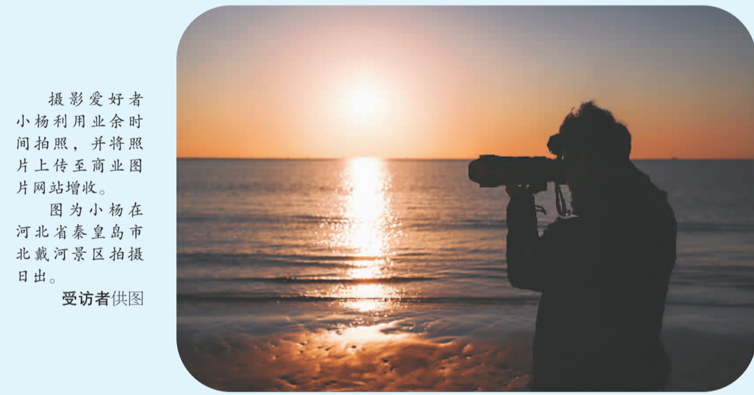
摄影爱好者小杨利用业余时间拍照，并将照片上传至商业图片网站增收。 图为小杨在河北省秦皇岛市北戴河景区拍摄日出。