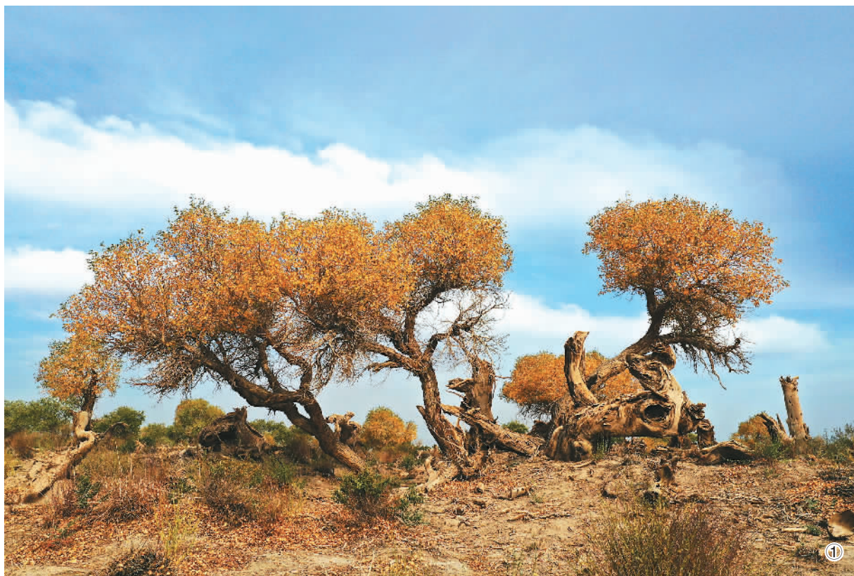
图①：新疆维吾尔自治区哈密市伊吾县淖毛湖镇伊吾胡杨林景区景色。

目前，中国已建立各类自然保护地近万个，约占陆域国土面积18%，提前实现《生物多样性公约》“爱知目标”所确定的17%的要求。在人民日报的报道中，中科院