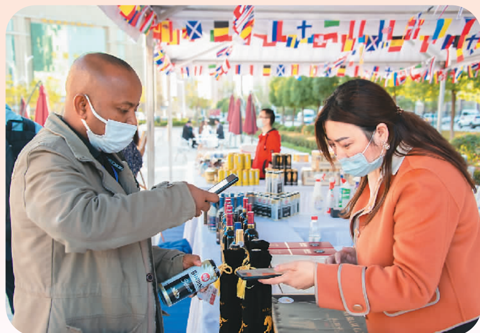
10月12日，与会嘉宾在扫码支付购买商品。