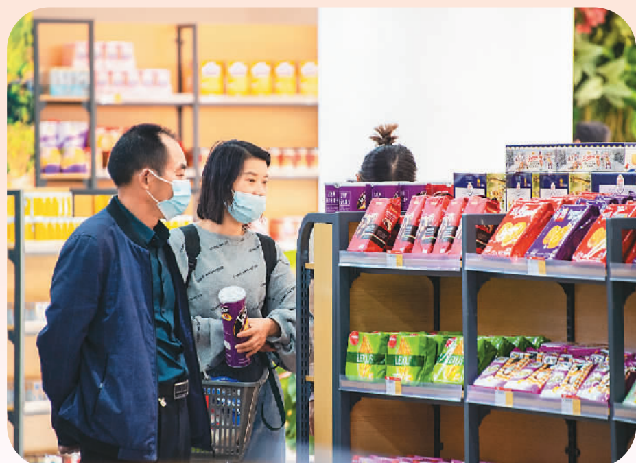
10月12日，参观者在选购进口商品。

本次大会以“智联世界，货通天下”为主题，由湖北省政府主办，武汉市政府、湖北省商务厅承办。上万名中外参展商、采购商和品牌商深入开展贸易洽谈与合作。汉交会将持续到本月26日。