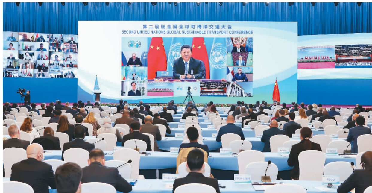
十月十四日晚,国家主席习近平以视频方式出席第二届联合国全球可持续交通大会开幕式并发表题为《与世界相交 与时代相通 在可持续发展道路上阔步前行》的主旨讲话。

新华社北京10月14日电 国家主席习近平14日晚以视频方式出席第二届联合国全球可持续交通大会开幕式并发表题为《与世界相交 与时代相通 在可持续发展