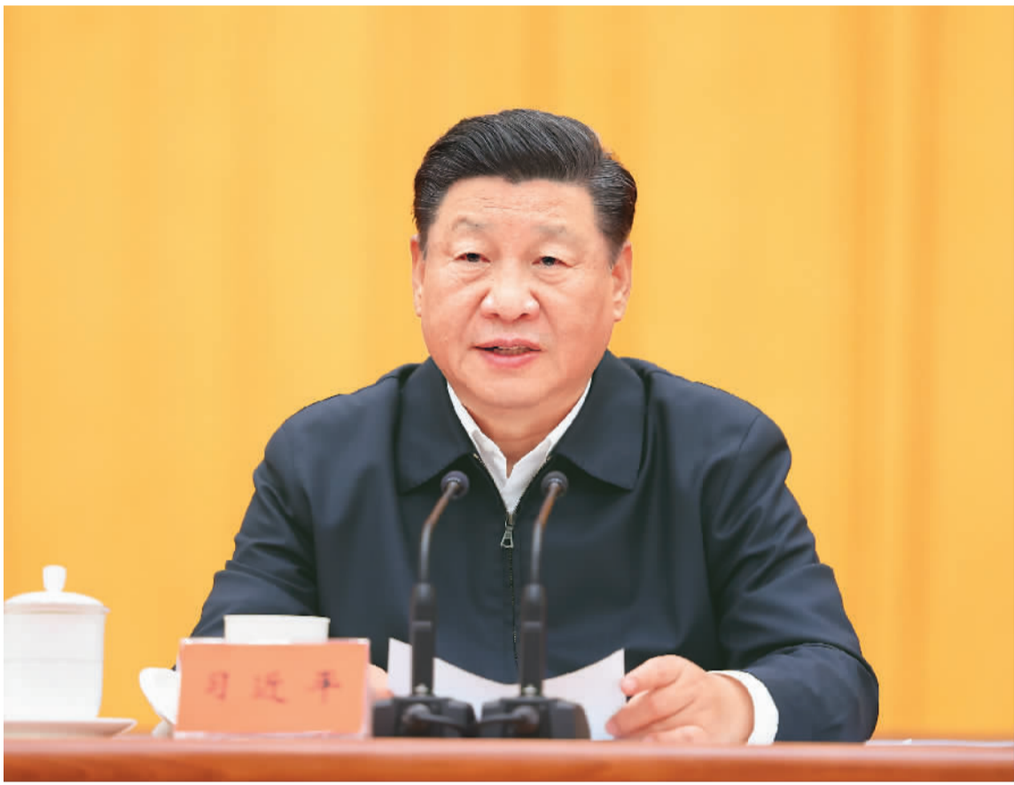
10月13日至14日,中央人大工作会议在北京召开。中共中央总书记、国家主席、中央军委主席习近平出席会议并发表重要讲话。

本报北京10月14日电(记者徐隽)中央人大工作会议10月13日至14日在北京召开。中共中央总书记、国家主席、中央军委主席习近平出席会议并发表重要讲话,强调人民代表大会制度是符合我国国情和实际、体现社会主义国家性质、保证人民当家作主、保障实现中华民族伟大复兴的好制度,是我们党领导人民在人类政治制度史上的伟大创造,是在我国政治发展史乃至世界政治发展史上具有重大意义的全新政治制度。我们要坚持中国特色社会主义政治发展道路,坚持和完善人民代表大会制度,加强和改进新时代人大工作,不断发展全