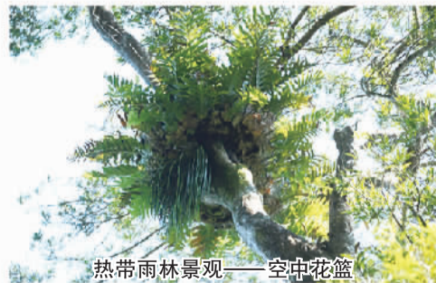
热带雨林景观——空中花篮