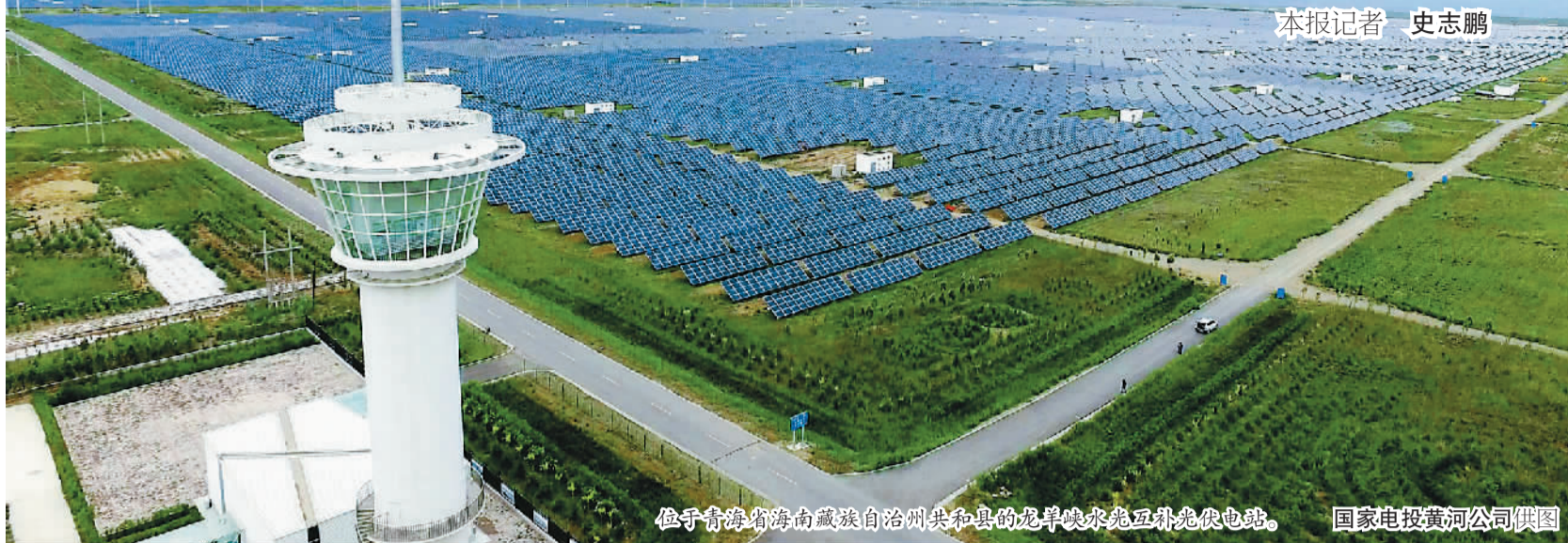
位于青海省海南藏族自治州共和县的龙羊峡水光互补光伏电站。