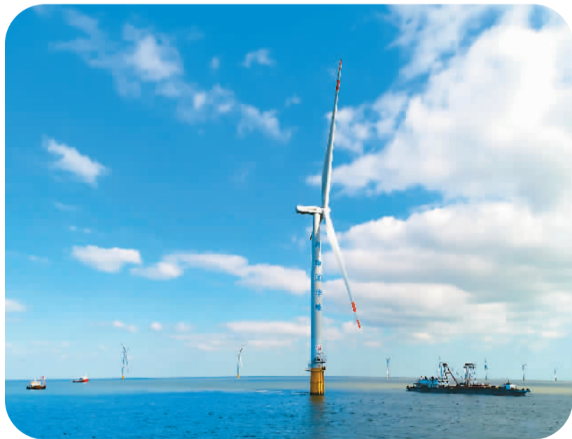
华能如东海上风电风机。

国家能源局负责人表示，接下来要加快发展风电、太阳能发电等非化石能源发电，不断扩大绿色低碳能源供给，“十四五”时期风电光伏要成为清洁能源增长的主力。