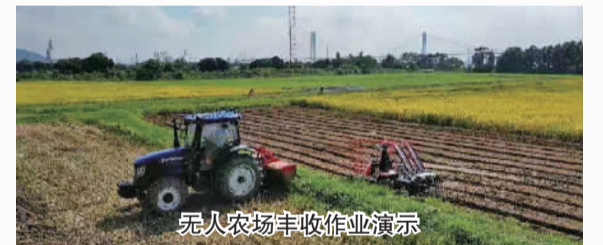
无人农场丰收作业演示

黄埔文化集团加快推进隆平稻香园和隆平院士港建设，结合农文旅融合发展，提升大吉沙岛基础设施和