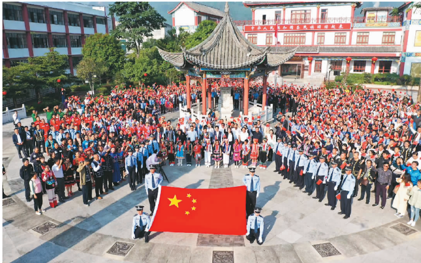
民族团结誓词碑已成为当地开展民族团结教育活动的重要场所。

民族团结誓词碑矗立在宁洱县城西北方, 在蓝天白云下或暴风骤雨中自带气场, 显示出沉稳、向上的生命力。