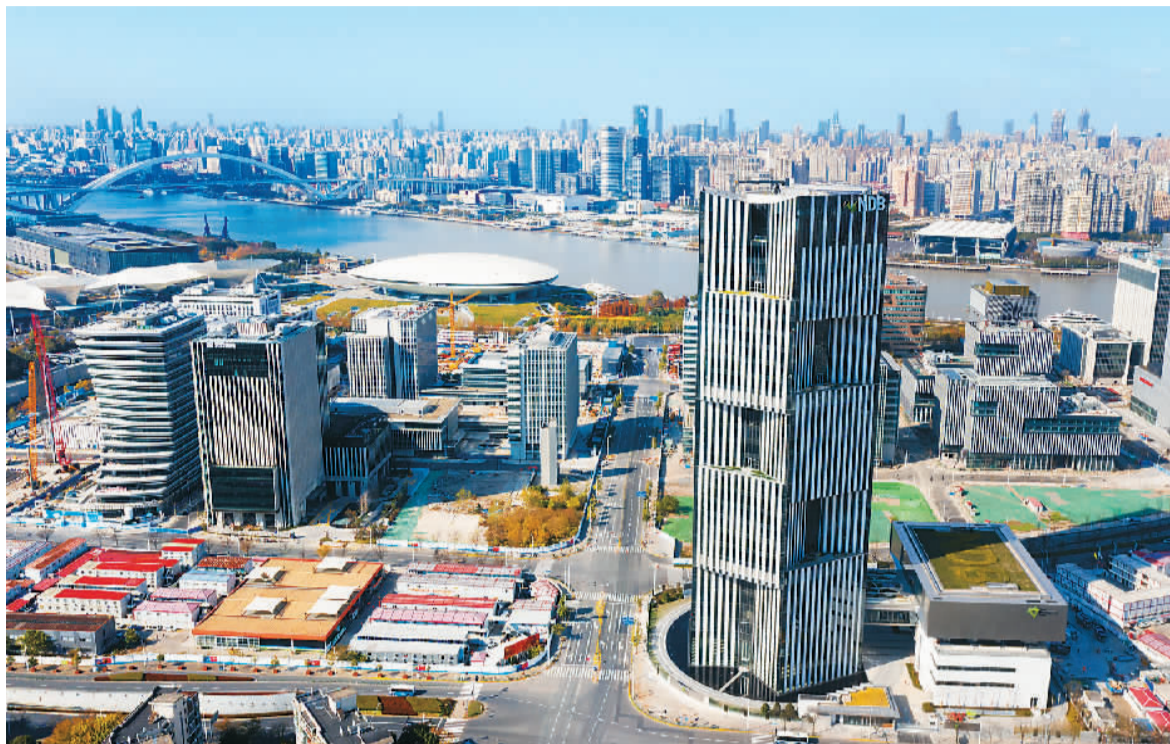
位于上海市浦东新区世博园区内的金砖国家新开发银行大楼。

中国国家主席习近平在讲话中指出，面对挑战，金砖国家要展现担当，推动践行真正的多边主义，推动全球团结抗疫，推动开放创新增长，推动共同发展。掷地有声的中国声音，进一步指明金砖合作未来的发展目标，引发国际社会的共鸣与点赞。