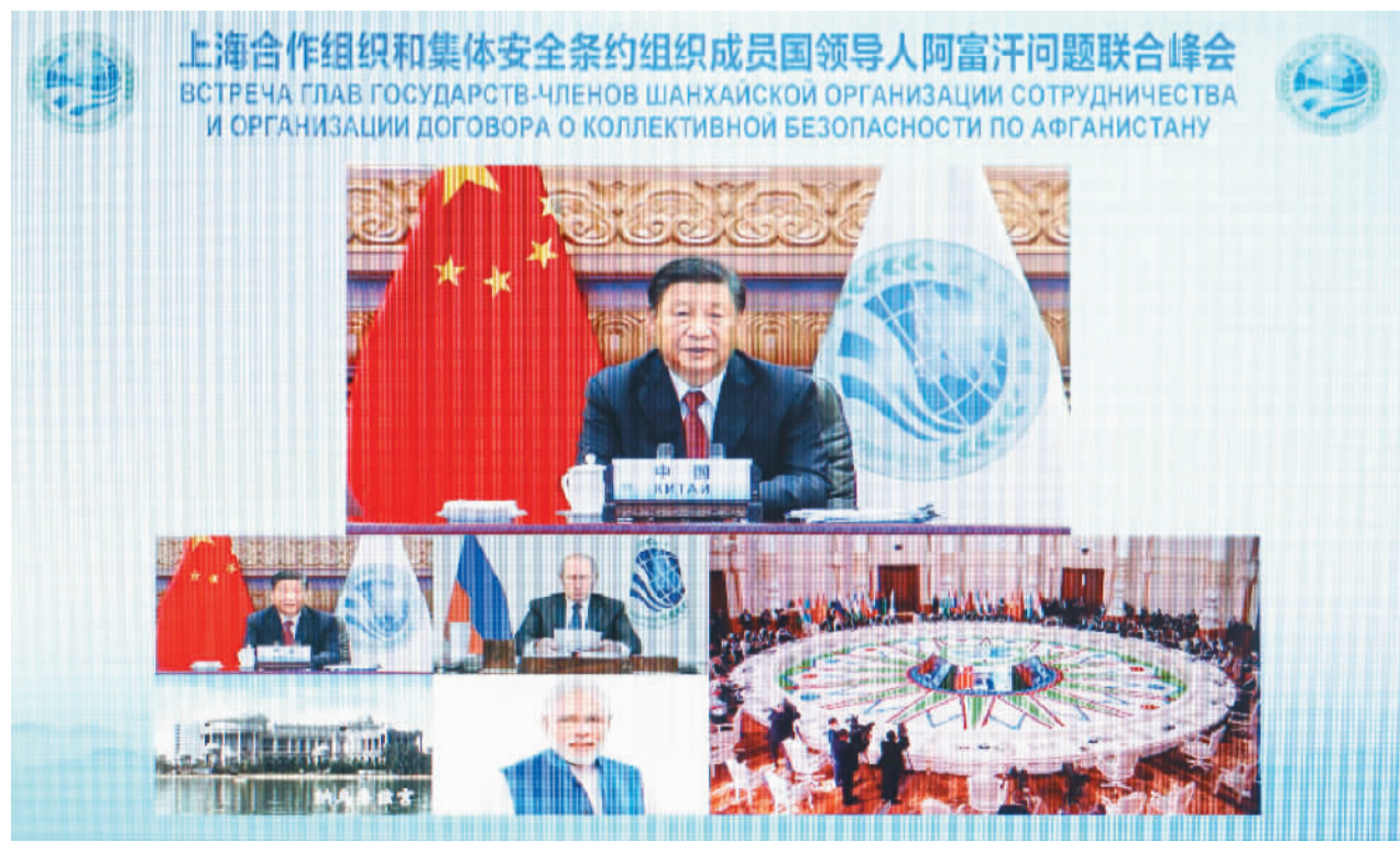
9月17日, 国家主席习近平在北京以视频方式出席上海合作组织和集体安全条约组织成员国领导人阿富汗问题联合峰会并发表重要讲话。

新华社北京9月17日电 国家主席习近平17日下午在北京以视频方式出席上海合作组织和集体安全条约组织成员国领导人阿富汗问题联合峰会并发表重要讲话。 习近平指出, 近期, 阿富汗局势发生根本性变化, 对国际形势、地区格局和安全稳定产生重要影响。目前, 阿富汗面临不少困难和挑战, 尽快恢复正常秩序, 实现局势软着陆, 是全体阿富汗人民的紧急要务, 国际社会和地区国家也需要密切关注。上海合作组织和集体安全条约组织成员国都是阿富汗