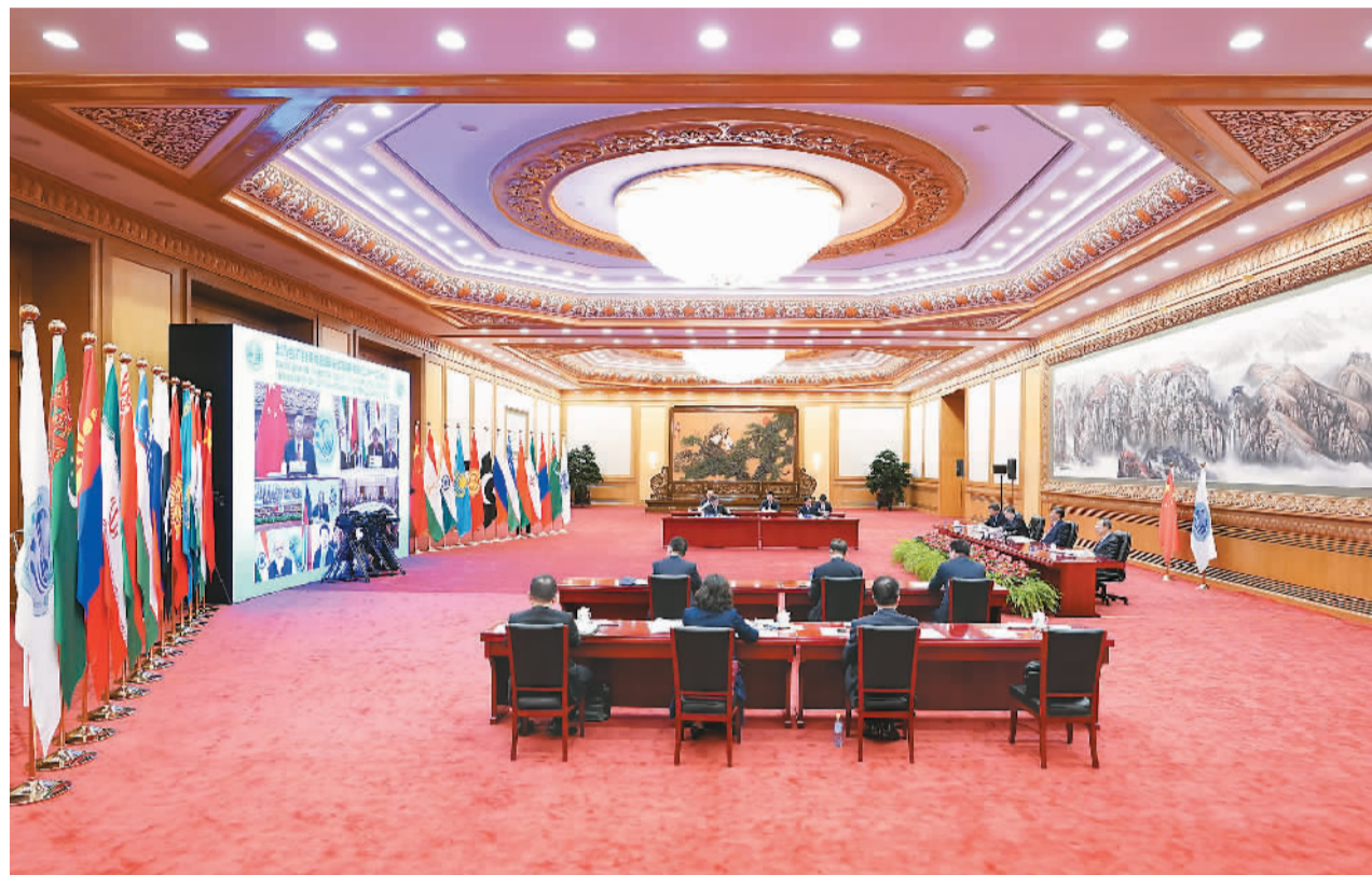
9月17日, 国家主席习近平在北京以视频方式出席上海合作组织成员国元首理事会第二十二次会议并发表重要讲话。

新华社北京9月17日电 国家主席习近平17日下午在北京以视频方式出席上海合作组织成员国元首理事会第二十二次会议并发表题为《不忘初心 砥砺前行 开启上海合作组织发展新征程》的重要讲话。(讲话全文见第二版) 习近平指出, 上海合作组织成立20年来, 始终遵循“互信、互利、平等、协商、尊重多样文明、谋求共同发展”的“上海精神”, 致力于世界和平与发展 and 人类进步事业, 为构建新型国际关系和人类命运共同体作出重要理论和实践探索。我们共促政治互信, 开创“结伴不结盟、对话不对抗”全新模式; 共护安全稳定, 坚决遏制毒品走私、网络犯罪、跨国组织犯罪蔓延势头; 共谋繁荣发展, 推动区域务实合作向纵深发展;