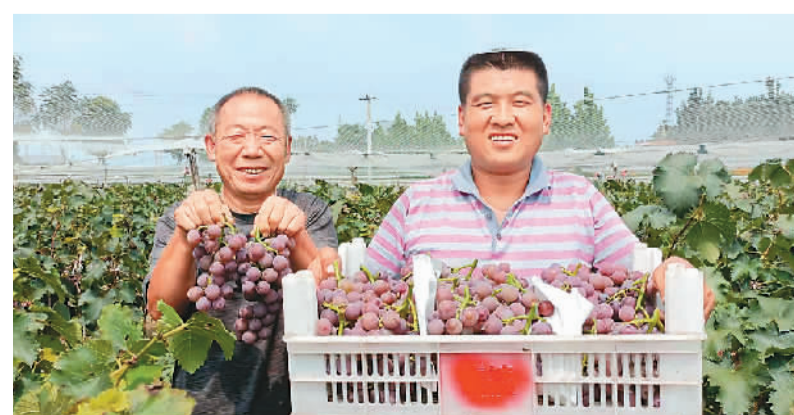
山东省冠县崇文街道近年来大力发展葡萄产业,种植面积达4000余亩,促进村民增收和乡村振兴。图为铺上村村民展示收获的葡萄。

图博会期间,由中宣部进出口管理局主办的庆祝中国共产党成立100周年精品出版物展将集中展示习近平总书记著作及相关图书、建党百年主题图书、重大主题出版图书、第五届中国出版政府奖图书和2020年中国好书、国家出版基金资助精品图书以及经典中国国际出版工程、丝路书香重点资助图书,大力营造共庆百年华诞、共创历史伟业的浓厚氛围。