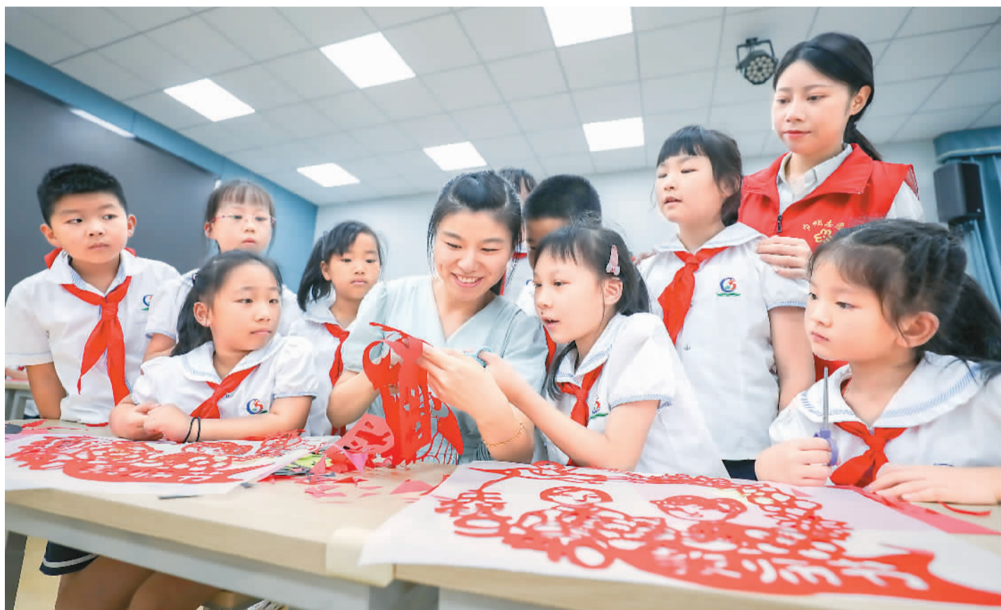
9月8日,浙江省湖州市龙泉小学、龙泉街道潘公桥社区共同开展“剪纸颂师恩”活动,庆祝即将到来的教师节。图为老师带领学生创作剪纸作品。