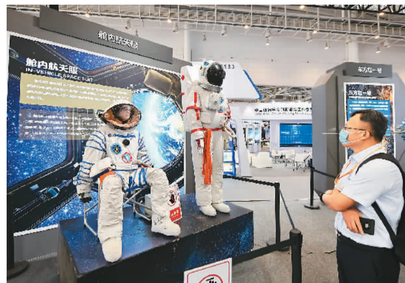
9月8日,2021金砖国家新工业革命展在福建厦门开展。除展会外,主办方还设置了专业论坛、企业交流、项目对接等多项配套活动,为推进金砖国家新工业革命伙伴关系建设提供更多机会。图为参观者在观看展出的“舱内航天服”。