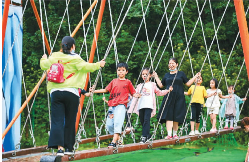
游客在浙江省永康市江南街道山门头村打造的岗谷岭景区游玩。

在“两山”理念诞生地浙江，乡村旅游在坚持绿色发展的路上不断探索创新。浙江仙居县淡竹乡位于国家级5A景区神仙居景区的核心区域，是典型的以林业为主的山区乡。通过大力发展民宿，乡村旅游获得长足发展。2020年，淡竹乡接待游客超300万人次，平均每家庭宿收入30万元。为解决乡村旅游迅速发展衍生的交通堵塞、垃圾乱扔、餐桌浪费等问题，当地推出“绿色货币”制度，游客每执行一个“绿色动作”，就能得到对应的“绿币”回报，积累的“绿币”，可用以抵扣房费、停车费等，或兑换相应物品。“保护好秀丽山水就是保护好‘金饭碗’”，已成为当地村