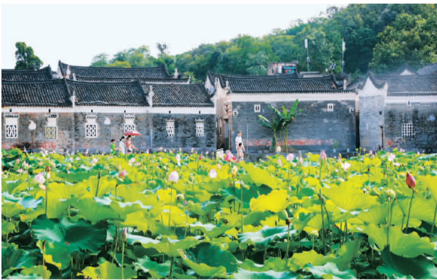
湖南省永州市新田县龙家大院古村，秋荷盛开，吸引众多游客前来打卡游玩。

在江苏常州溧阳李家园村，过去一亩竹林每年产出两三千斤，开展挖笋等旅游体验活动后，每亩每年产出增加到