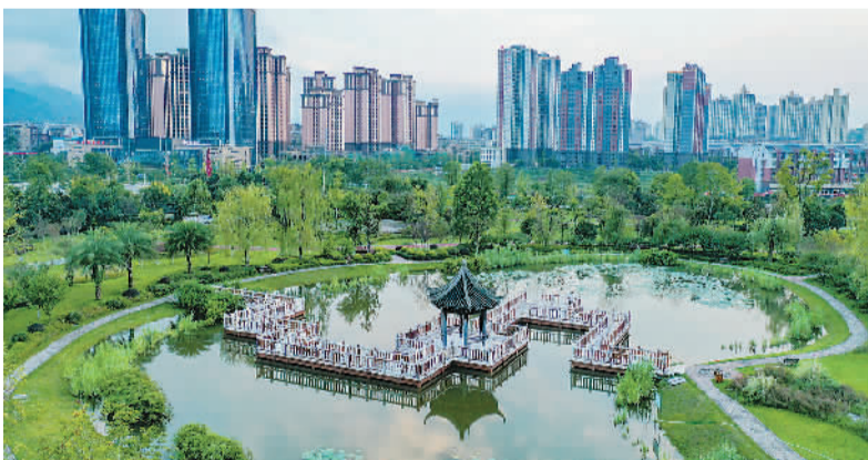
近年来,四川省华蓥市在淘汰高污染高耗能产业同时,不断加大生态文明建设,将曾是矿山企业弃渣的堆放地打造成生态休闲广场,优化城市环境。图为近日拍摄的华蓥市城北公园。