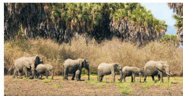
前景不容乐观的濒危世界遗产坦桑尼亚塞卢斯禁猎区(Selous Game Reserve)。

National Park)常年受到安全和政治动荡、武装人员偷猎、石油开采、缺乏管理资金等问题困扰，于1999年被列入“濒危”。近两年遗产地获得多方经济支援，并开展了反偷猎政策、物种监测、石油开采管理等多项保护措施，遗产保护状况得到一定改