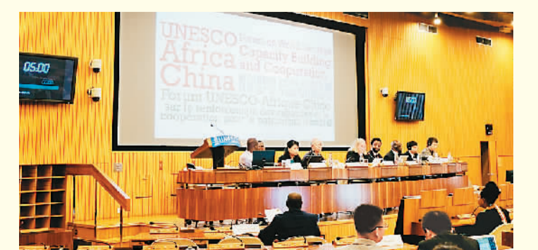
2019年举行的“联合国教科文组织-中国-非洲世界遗产能力建设与合作论坛”。

2019年7月，第43届世界遗产委员会会议期间，举行了“非洲世界遗产申报”边会。来自非洲地区和中国众多代表就中国世界遗产的申报机制和非洲未来世界遗产申报和保护管理工作开展讨论。2021年7月，第44届世界遗产委员会会议期间，由联合国教科文组织非洲优先和对外关系部门、世界遗产中心、中国联合国教科文组织全国委员会、清华大学国家遗产中心联合主办的“世界遗产保护管理能力建设——迈向未来的中非合作”边会在福州召开。世界遗产中心主任梅希蒂尔德·罗斯勒回顾了以往中非论坛及相关成果，赞赏中国为非洲世界遗产在申报和持续保护领域所提供的帮助与支持。第44届世界遗产大会主席田学军表示，中国秉持共筑中非命运共同体理念，高度重视与非洲在世界遗产保护方面的合作，支持面向乌干达、贝宁、坦桑尼亚等非洲国家世界遗产地管理者开展的遗产风险管理及保护培训，这受到联合国教科文组织的高度认可和非洲国家的热烈欢迎。为落实联合国教科文组织“非洲优先”事项，中国将进一步支持非洲国家的世界遗产保护工作，实施世界遗产保护领域人才培养计划。