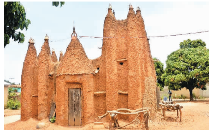
2021年新申报列入的非洲文化自然遗产：科特迪瓦北部苏丹风格清真寺(Sudanese Style Mosques in Northern Côte d'Ivoire)。

2021年度世界遗产保护状况报告显示，《濒危世界遗产名录》中的非洲地区世界遗产缺乏有效的保护管理体系，又面临着矿业开采、非法狩猎活动、国内武装冲突等威胁因素以及缺乏经济支持和人力资源匮乏等多重影响。以上因素大致勾勒出非洲地区世界遗产面临的核心挑战。刚果萨隆加国家公园(Salonga