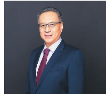
孙燕 田蕊：清华大学建筑设计学院 陈凯 顾芸培：清源文化遗产团队 数据来源：世界遗产中心官网 https://whc.unesco.org