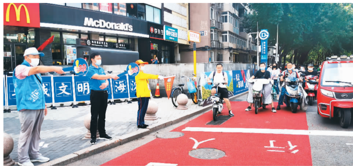
志愿者、文明引导员在北京市海淀区黄庄路口引导行人、非机动车文明出行。