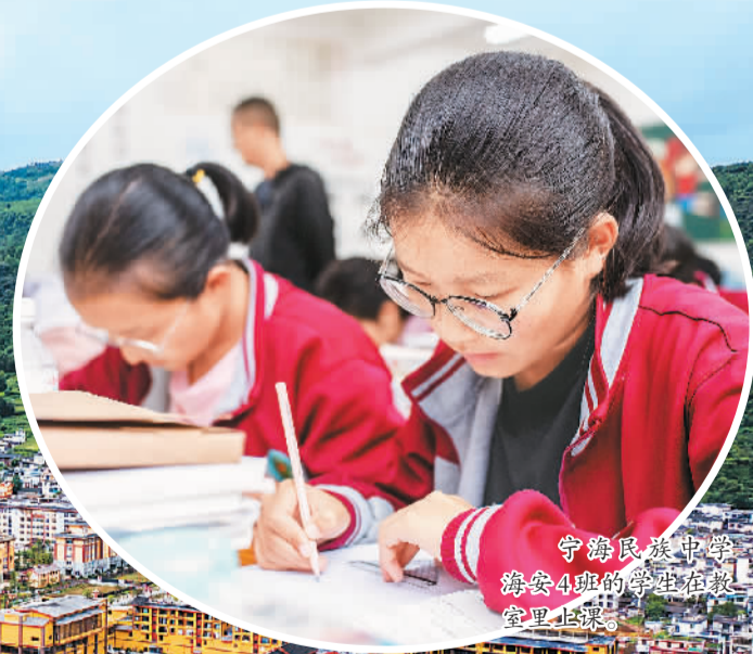
宁海民族中学海安4班的学生在教室里上课。