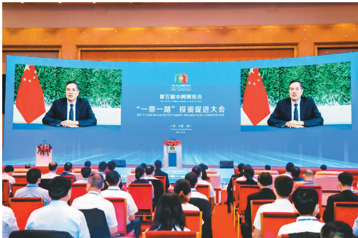
近日，第五届中国—阿拉伯国家博览会“一带一路”投资促进大会在宁夏回族自治区银川市举办。

博览会开幕之际，中国国家主席习近平向博览会致贺信，充分体现了中方对发展中阿战略伙伴关系的高度重视，为中阿携手前进、开创美好未来注入信心和动力。