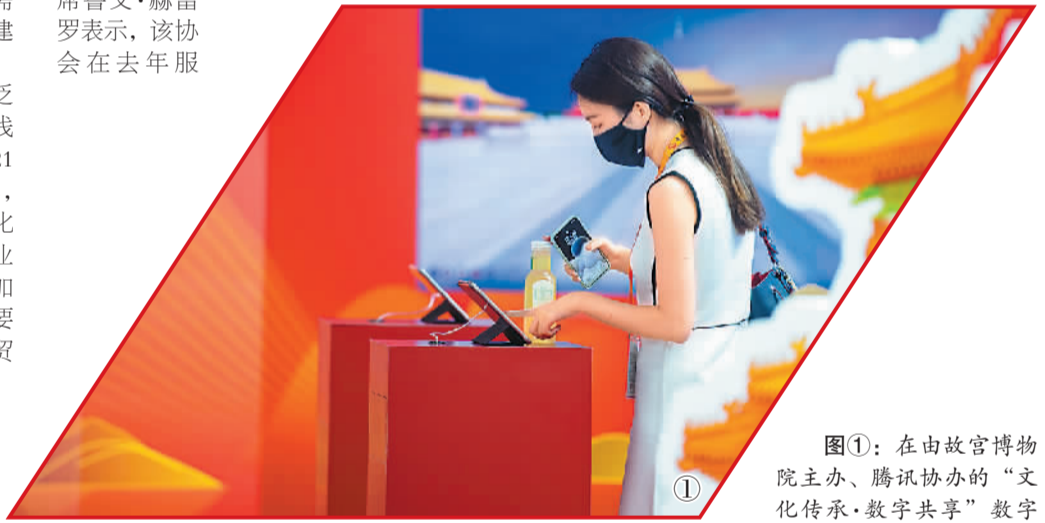
图①：在由故宫博物院主办、腾讯协办的“文化传承·数字共享”数字故宫体验专区，推出了“数字文物”“数字考古”“数字服务”三大板块，全方位展示了故宫20多年来的数字化成果。图为9月1日，国家会议中心展馆内，与会人员在体验故宫博物院的创意设备。

国家对外开放研究院教授庄芮说，“服贸会联通世界和中国，将为近年来持续低迷的世界经济注入新活力、新动力，提振全球信心，促成更多服贸领域的国际合作，促进全球服务贸易发展，进而推动世界经济复苏。”