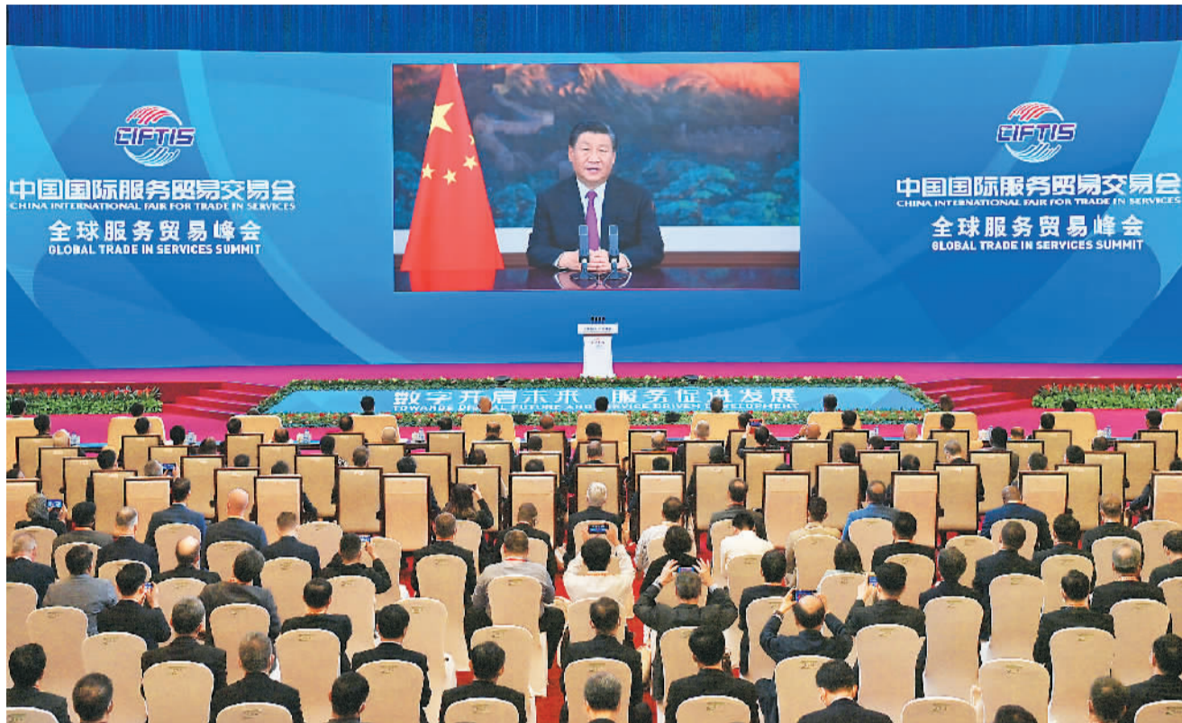
9月2日晚, 国家主席习近平在2021年中国国际服务贸易交易会全球服务贸易峰会上发表视频致辞。

新华社北京9月2日电 国家主席习近平2日晚在2021年中国国际服务贸易交易会全球服务贸易峰会上发表视频致辞。