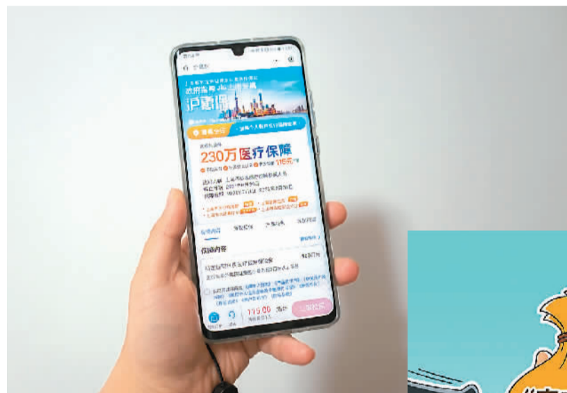
▲今年4月底，由9家保险公司共同承保的上海城市定制型商业补充医疗保险“沪惠保”正式上线。