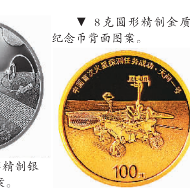
▲8克圆形精制金质纪念币背面图案。

样及面额。在纪念币规格和发行量方面，150克圆形金质纪念币为精制币，含纯金150克，直径60毫米，面额2000元，成色99.9%，最大发行量1000枚。8克圆形金质纪念币为精制币，含纯金8克，直径22毫米，面额100元，成色99.9%，最大发行量30000枚。30克圆形银质纪念币为精制币，含纯银30克，直径40毫米，面额10元，成色99.9%，最大发行量60000枚。