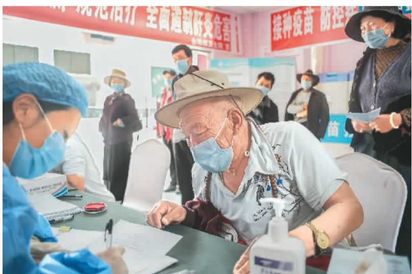
▲ 在四川甘孜州稻城县疫苗接种点,工作人员为准备接种人员登记信息。