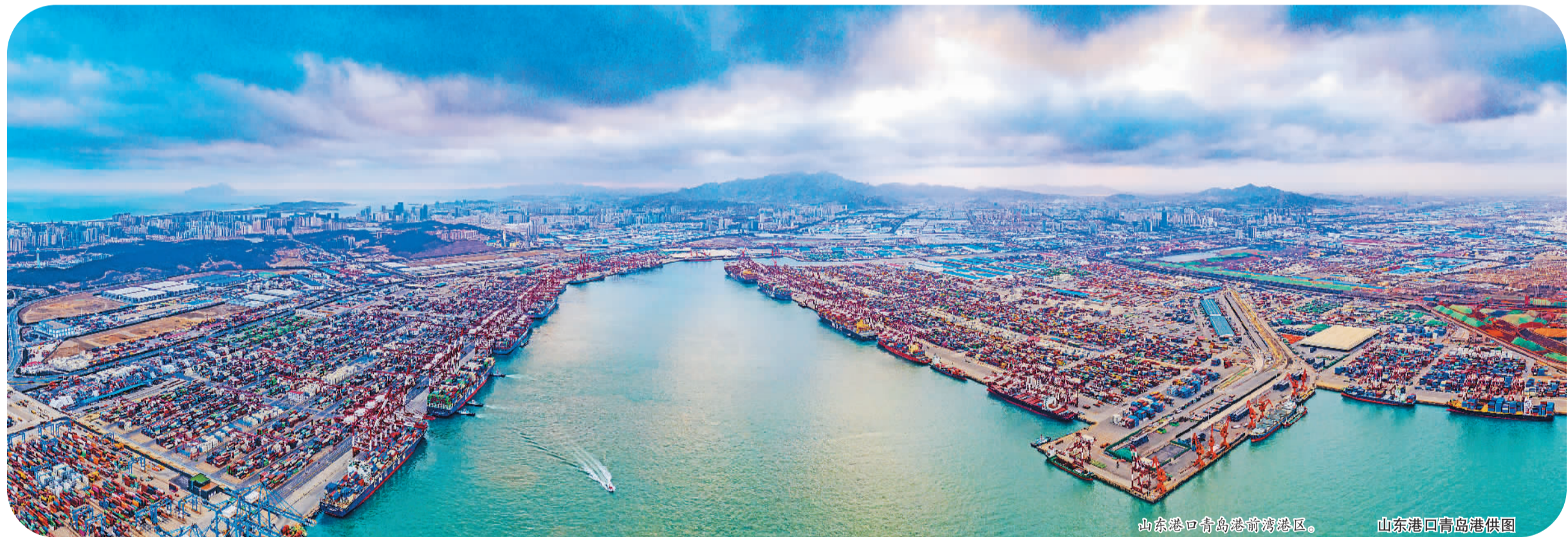
山东港口青岛港前湾港区。

已跑赢上半场的青岛，正在发力后半程。青岛外贸就像一艘远航的巨轮，在高质量发展的航道上乘风破浪，驶出新篇章。