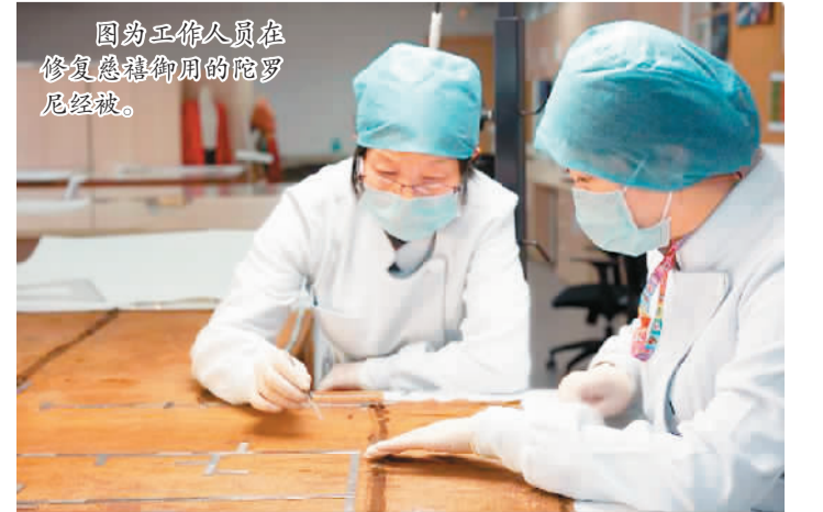
图为工作人员在修复慈禧御用的陀罗尼经被。

清东陵是中国现存规模最大、体系最完整、布局最合理的帝王陵墓建筑群。2000年11月被列入《世界遗产名录》。(白云水)