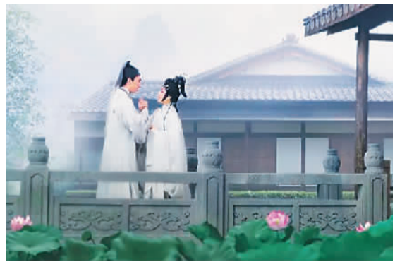
粤剧电影《白蛇传·情》剧照。