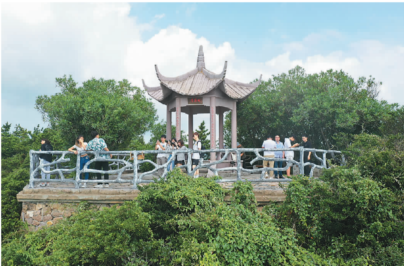
近日，十余名台湾青年齐聚浙江省温州市洞头区，以光影艺术记录瓯越风情。图为台湾青年在洞头半屏山的盼归亭参观和拍摄。

6月17日，航天员聂海胜、刘伯明、汤洪波乘神舟十二号载人飞船前往空间站天和核心舱。目前，神舟十二号载人飞行任务已经进入第三个月。后续，航天员乘组将继续开展空间科学实验和技术试验。此次“时代精神耀香江”之仰望星空话天宫活动，将延续此前国家航天科学家团队访港和月壤入港等掀起的“航天热潮”，加深香港市民对国家航天成就的了解。