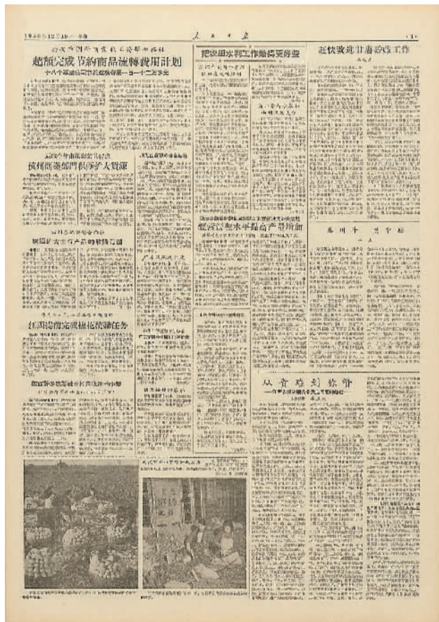
1956年12月10日的人民日报第三版。