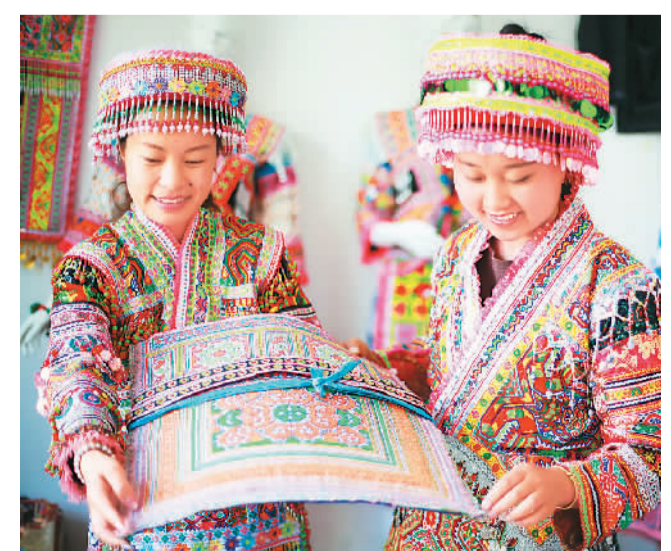
贵州省黔西市红林彝族苗族乡通过创建“刺绣作坊”,运用当地刺绣、蜡染等苗族传统手工艺,承接旅游商品订单。图为该乡鱼塘村苗族妇女在查看刺绣成品背扇。

在澳门餐饮业及零售业景气调查中,业务表现指数和业务展望指数的数值均介乎0至100间。当指数数值高于50,表示行业在该月的业务表现或对下月的业务展望较对同期理想;当指数低于50,则表示较为逊色。