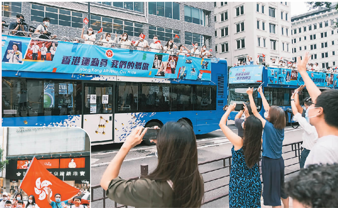
上图:市民挥手欢迎运动员。左图:市民高举中国国旗和香港区旗欢迎运动员。中新社记者 陈永诺摄

8月19日,东京奥运会中国香港代表团成员乘坐巴士巡游活动,由香港红磡体育馆开出至西九文化区戏曲中心,沿途不少民众在马路两旁欢迎运动员。