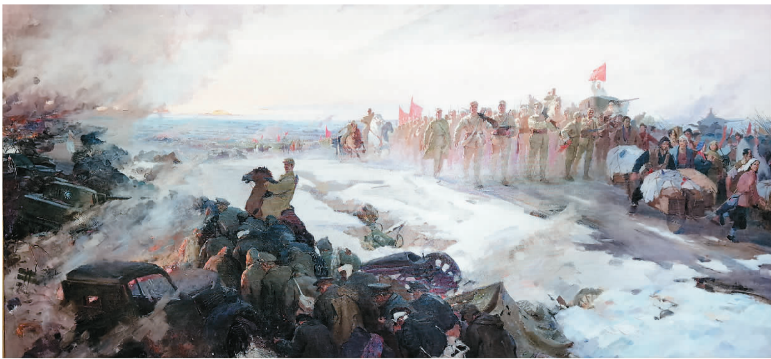
▲ 淮海大捷（油画） 鲍加 张法根 中国国家博物馆藏