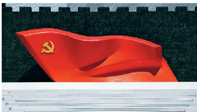
▲ 雕塑《旗帜》坐落于中国共产党历史展览馆西侧广场

在庆祝中国共产党成立100周年的各种活动中，多处能看到雕塑家吴为山的作品。其领衔创作的大型党旗雕塑《旗帜》，甫一亮相中国共产党历史展览馆，就引发关注。《旗帜》的基座高1米，旗帜部分高7.1米、长21米，象征1921年7月1日。吴为山说：“这样一面迎风招展、气势如虹的党旗，象征着中国共产党历经百年伟大历程而意气风发的气概。”