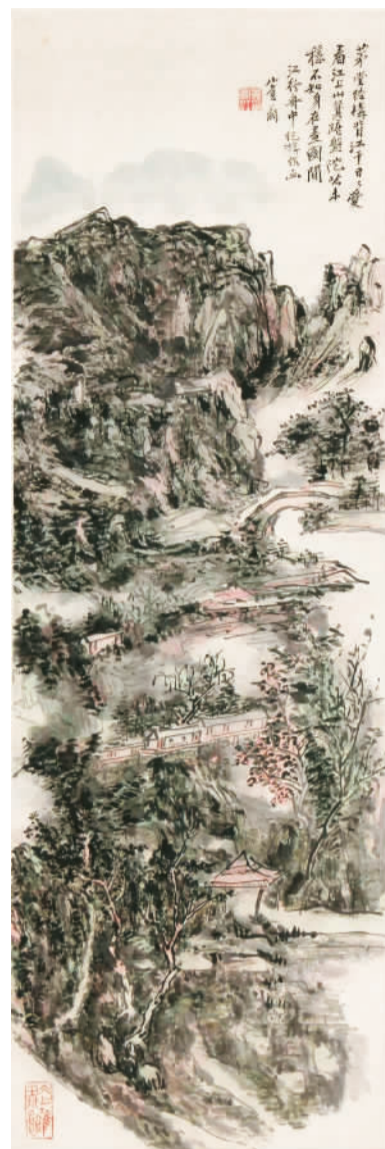
▲ 江山上（中国画） 黄宾虹

展出作品时间跨度大，囊括中国革命、建设、改革各个时期。古元的木刻版画《人桥》以黑版为主，套以橘红、黄绿二色，在对比中表现出硝烟四起、火光冲天的战斗气氛，映现出士兵奋勇前进的身影，艺术地还原了解放战争时期大军渡江的英勇无畏；董希文的油画《千年土地翻了身》以朴素的画风和真挚的感情，表