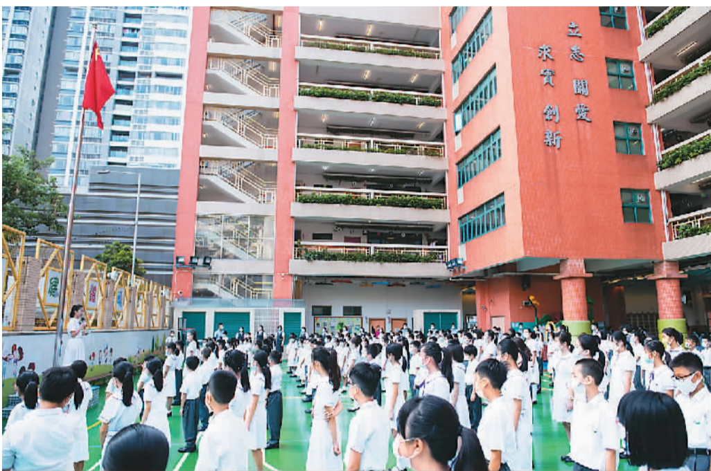
澳门培华中学附属小学暨幼稚园学生参加升国旗仪式。

冒着细雨,澳门青年在井冈山革命烈士陵园敬献花圈、吊唁革命先烈,并聆听井冈山根据地建立