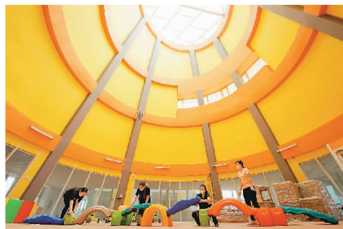
河北省沙河市近来进一步完善学前教育公共服务体系,不断推进普惠性幼儿园建设,投资4100余万元新建普惠性幼儿园11所,同时将20所城镇小区配套幼儿园办成普惠园,不断提升普惠性幼儿园覆盖率。图为沙河市一家幼儿园的老师在整理玩具。

统计显示,自2月26日正式启动新冠疫苗接种计划至8月16日,香港共有约376.37万名市民已接种第一剂疫苗,占资格免费接种疫苗人数的55.3%;约293.63万名市民已接种第二剂疫苗,占资格免费接种疫苗人数的43.2%。