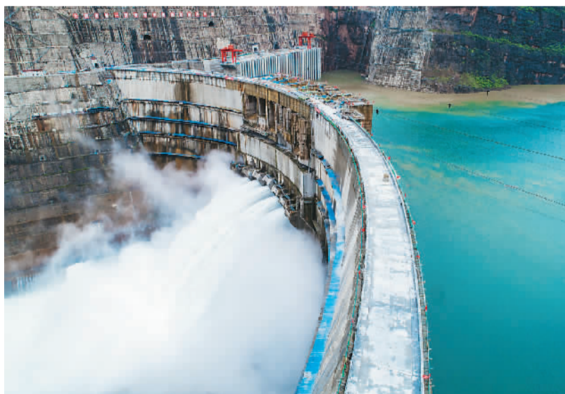
白鹤滩水电站大坝坝面。