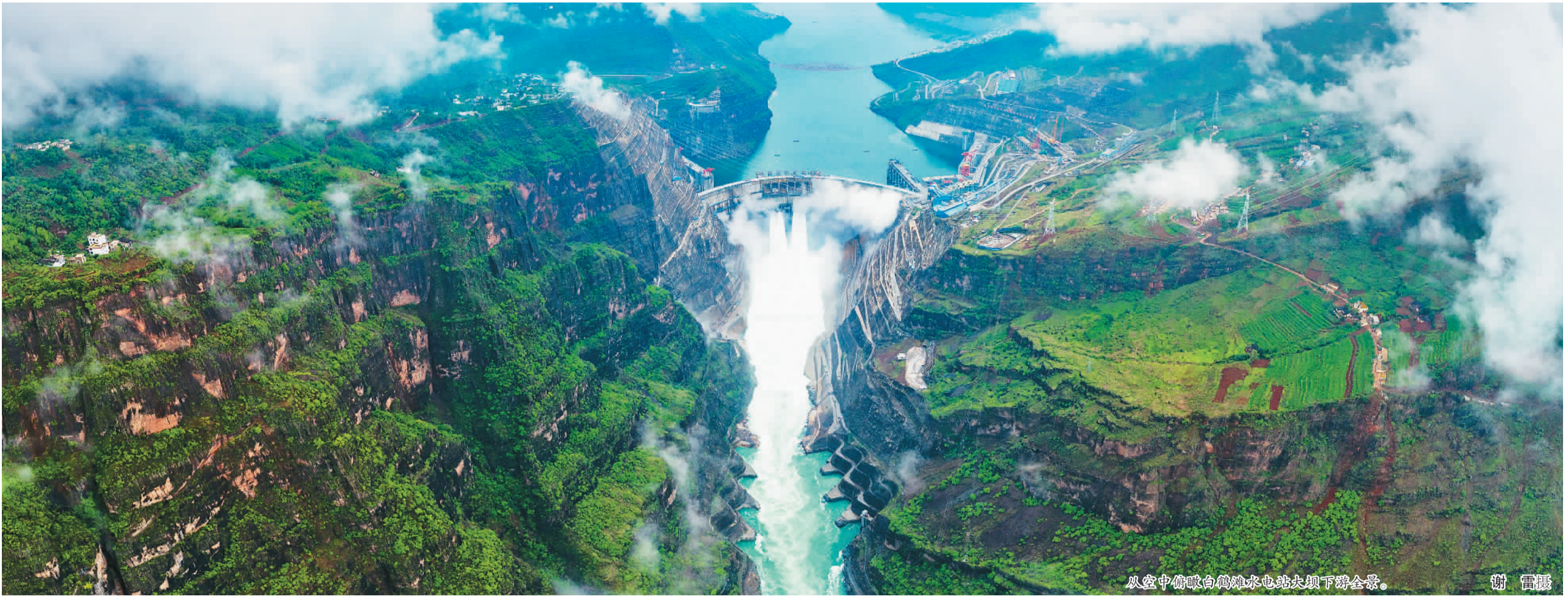
从空中俯瞰白鹤滩水电站大坝下游全景。