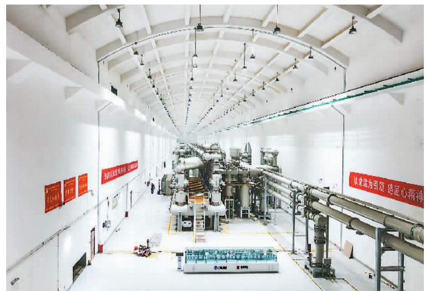
白鹤滩水电站左岸技术设备厂房内景。