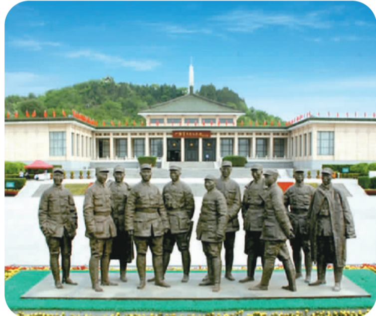
上图：中国在太原卫星发射中心用运载火箭成功将卫星送入预定轨道。 左图：八路军太行纪念馆的八路军将领雕塑。

太原市重型机械集团、太原市中国煤炭博物馆、太原钢铁集团书写了一个个传奇，再现了红色军国防工业从弱到强创新发展的辉煌历史。当前，山西正在全方位推进高质量发展，要让创新成为第一动力，让绿色成为山西全方位