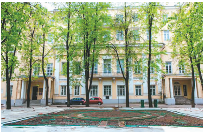
莫斯科中山大学旧址的俄式建筑。(资料照片)