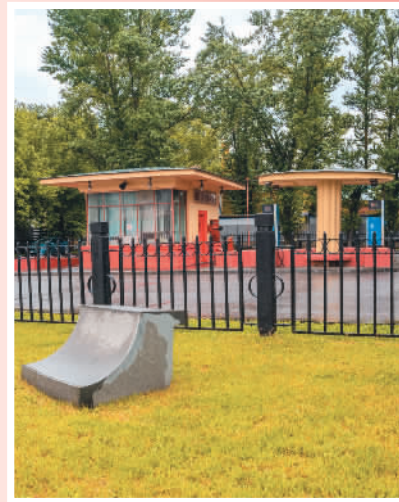
沃尔洪卡街16号附近的加油站。

这所大学里的大部分老师、教授都来自苏联。其中就包括不少老布尔什维克，例如卡尔·伯恩哈多维奇·拉狄克先生，他同时也是莫斯科中山大