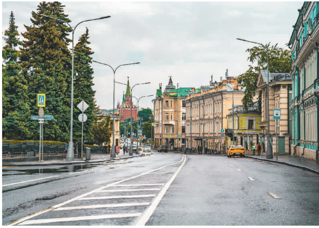
沃尔洪卡街街景。