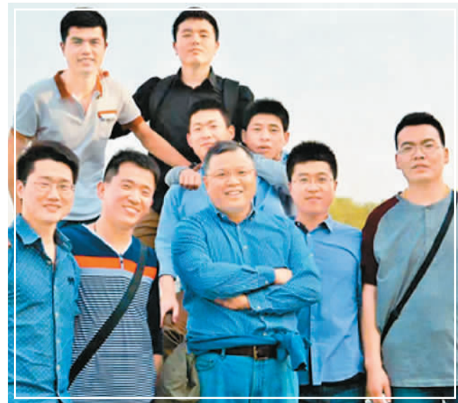
黄大年（前排中）与学生在一起。