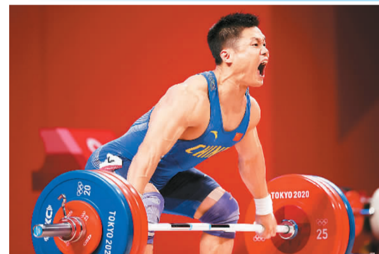
7月31日，在东京奥运会举重男子81公斤级决赛中，中国选手吕小军夺冠。

在东京奥运会备战周期，国家体育总局积极推广使用国内外最新科研仪器设备，将大数据、传感器、视频分析、3D打印、风洞实验、电子系统模拟比赛等新技术逐步融入训练实践过程，并从高等院校、科研院所、医疗机构等单位选拔专业人员，组建国家队复合型团队，有效提升了中国体育代表团在东京奥运会上的整体竞争力。