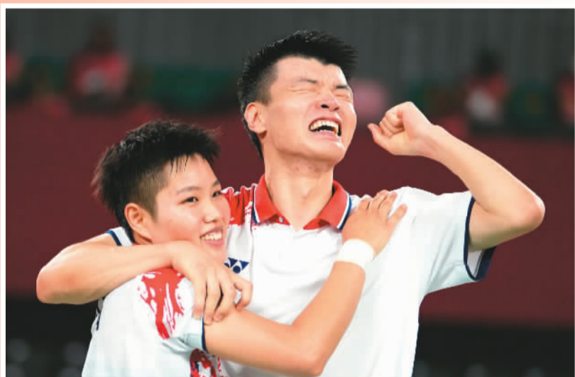
7月30日，在东京奥运会羽毛球混合双打决赛中，中国选手王懿律/黄东萍以2比1战胜另一对中国选手郑思维/黄雅琼，获得冠军。

东京奥运会圣火熄灭，中国体育代表团载誉归来。本届奥运会，中国运动员收获38金18铜共88枚奖牌，金牌数和奖牌数均位居第二，追平了2012年伦敦奥运会时的境外参赛最好成绩。