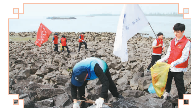
志愿者在江苏省如皋市长江如皋段捡拾垃圾。

在中国，像周涛这样自发成为巡护员加入保护生态环境队伍的人不在少数。在青海可可西里正式被确立为国家级自然保护区的前两年，许多牧民就开始自发组建巡山队，骑马上山开展生态保护工作