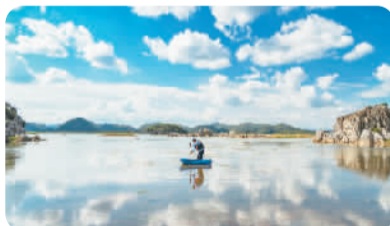
云南省曲靖市沾益区大坡乡海峰湿地巡护员清理湿地水面漂浮物。

巡护员，是指从事野生动植物保育和自然环境保护工作的相关人员，他们的工作包括巡逻、监控野生动物、打击偷猎、协调当地社