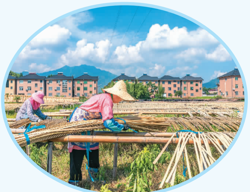
浙江省湖州市安吉县天荒坪镇，竹农们忙着晾晒加工好的竹篾。竹篾是加工竹席、竹椅等竹制品的原材料。

湖州师范学院“两山”理念研究院常务副院长、浙江大学土地与国家发展研究院教授王景新认为，安吉农商银行首笔竹林碳汇质押贷款的发放，其创新和实践，不仅对全国竹产区有里程碑的示范意义，使竹林经营者把提质增效与增收相结合，促进竹林生态价值货币化以及竹林碳汇产业的形成，通过竹林碳汇项目开发增加收入，提高应对气候变化的能力。