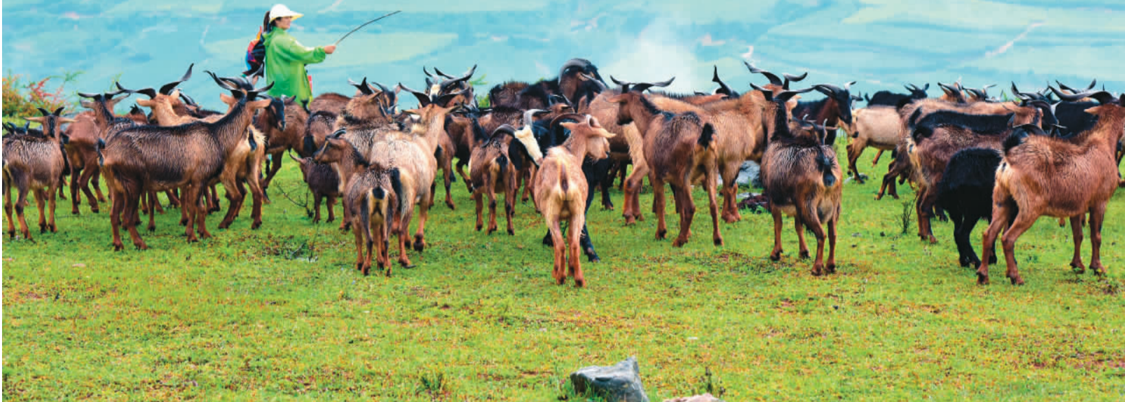
云南省红河哈尼族彝族自治州弥勒市东山镇的牧场风光。

极度濒危灭绝物种疏花水柏枝重现长江，梅花鹿群从几只扩大到几十只，野生熊猫、东北虎、豹子越来越多地活跃在自然保护区中……当人们赞叹中国生态环境越来越好，生物多样性越来越丰富时，不要忘记一群默默守护绿水青山的特殊人群——巡护员。在中国，近500处国家自然保护区里活跃着巡护员的身影，他们日复一日不辞辛苦地守护着广大的野生动物栖息地和自然保护区。