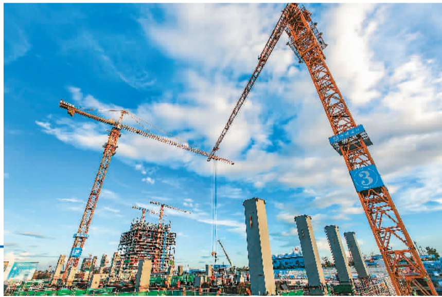
▶海口江东新区是海南自由贸易港重点园区，目前已签约引进多家世界500强企业。图为该区项目施工现场的繁忙施工景象。