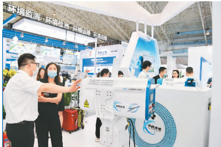
▲7月13日，第十九届中国国际环保展览会及2021环保产业创新发展大会在京开幕。德国、美国、法国、芬兰、日本等国的百余家驻华外资企业参展。图为展会现场。