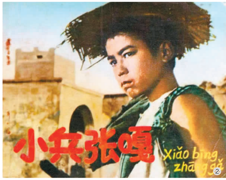
图①：小说《小兵张嘎》 图②：电影《小兵张嘎》

演出结束后，还召开了专家研讨会。专家们就文旅演艺如何弘扬丝路精神、创作文艺精品等话题进行了深入探讨。陕西省文化和旅游厅相关负责人表示，《丝路之声》的推出将进一步促进陕西文化旅游对外交流合作。