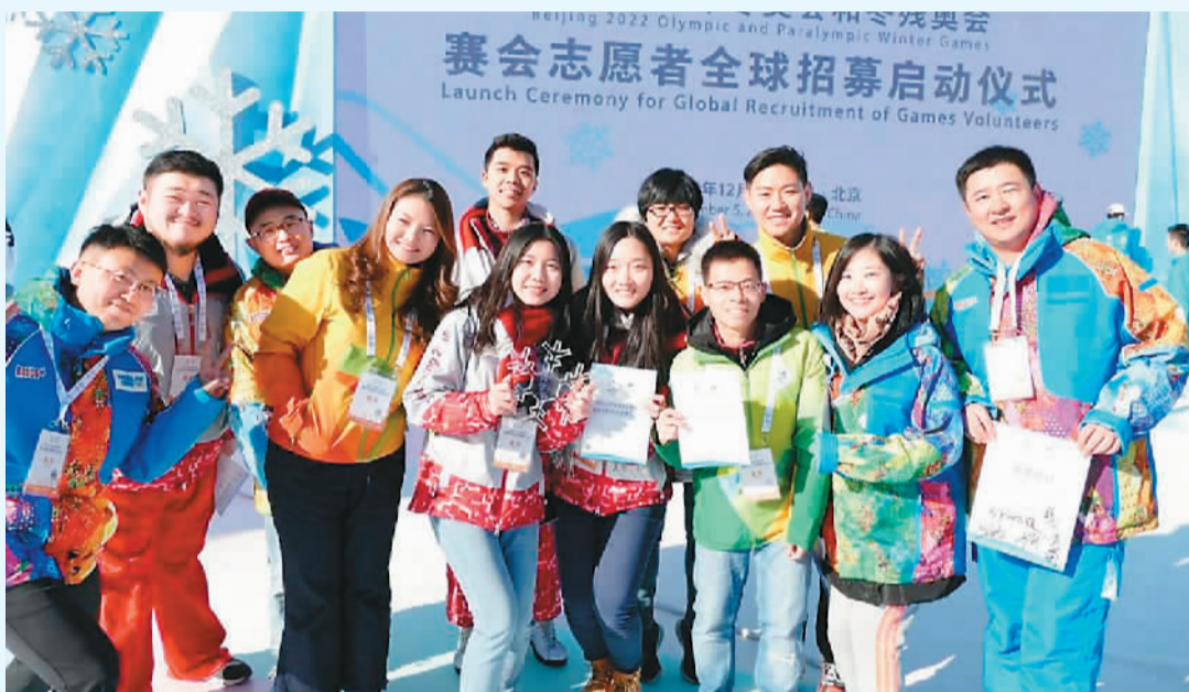
2019年12月5日，北京冬奥会和冬残奥会赛会志愿者全球招募启动仪式举行。