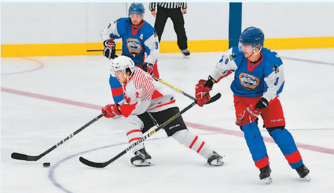
2019年11月7日，北京冬奥会冰球项目首场资格赛举行。