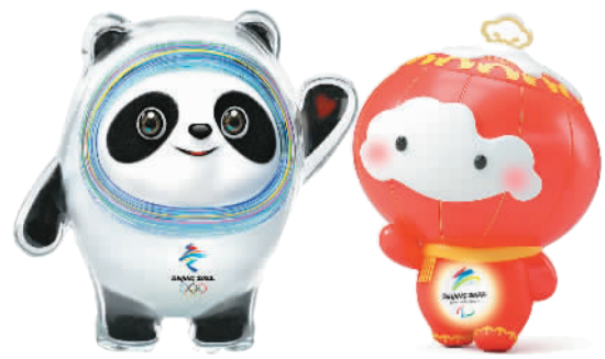
北京冬奥会吉祥物“冰墩墩”（左）和冬残奥会吉祥物“雪容融”。