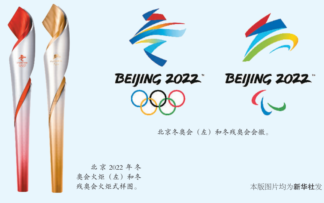
北京冬奥会（左）和冬残奥会会徽。